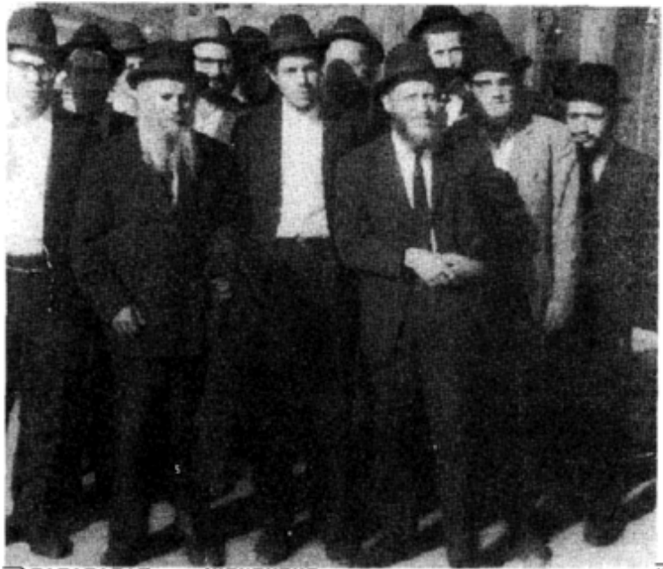
הרב הראשי לארץ ישראל