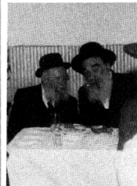
עם כ"ק האדמו"ר מסטריקוב שליט"א

יקר הדבר שראיתי אצל "החפץ חיים" זצוק"ל, זה שכל חייו ואמנו היו רק בתורה במעלה. ותמיד אמר שצריך לדקדק שלא לבטל כלום מעסק התורה שלא יהיה עליו ח"ו תביעה מהתורה עצמה. וברצוני לס' מר ככם מה שראיתי פעם אצל "החפץ חיים" שהיה יושב וימברך ברכת המאן וכאשר לא יכלא את תצריכיו לא לידו שחזק בשר ודם ולא לידו הולאותה היה נאנח רבות. וכמה פעמים שאלו אותו לפרש הדבר, והשיב: תד' עו' לכם כי מתחילי התורה ותומכיה יבואו "בגן עדן" ליד פש את הספי' שהיוכיל נטיסם עבור לומדי התורה: את