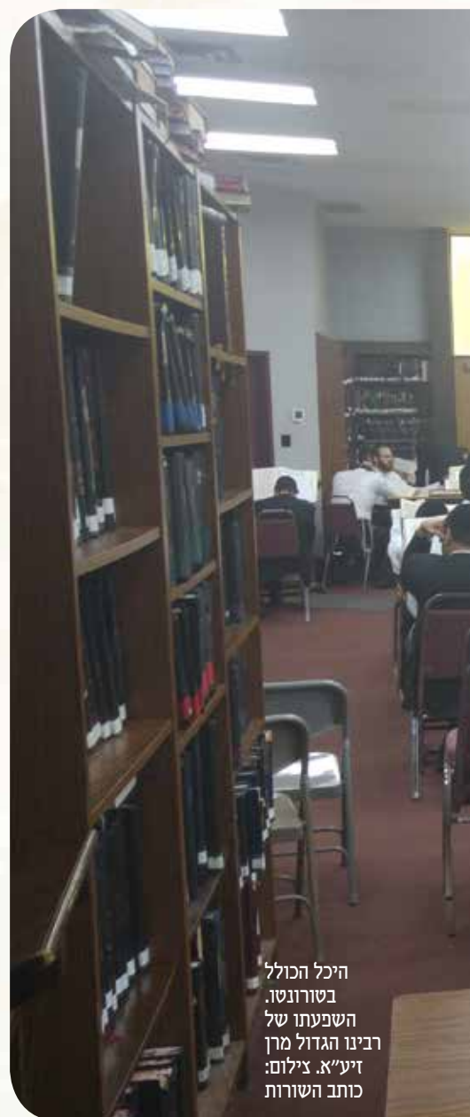
היכל הכולל בטורונטו. השפעתו של רבינו הגדול מרן זיע"א.

על מנת להקים מקומות של תורה לא די לנו בעשיית "דברים טובים" בעלמא, אלא עלינו לפעול בכוח עמל ויגיעת התורה. אצלנו בטורונטו סבר מרן זיע"א שניתן לחולל מהפכה, על אף שהיה זה בגדר חלום, וכיצד ניתן לעשותה? דווקא על ידי פתיחת כולל אברכים. לכאורה דבר הכי מופרך שיתכן. לא פעילות של קירוב, גם לא חוגים והרצאות. תפתחו כולל, הוא אמר, והכל כבר יבואו בעקבותיו.