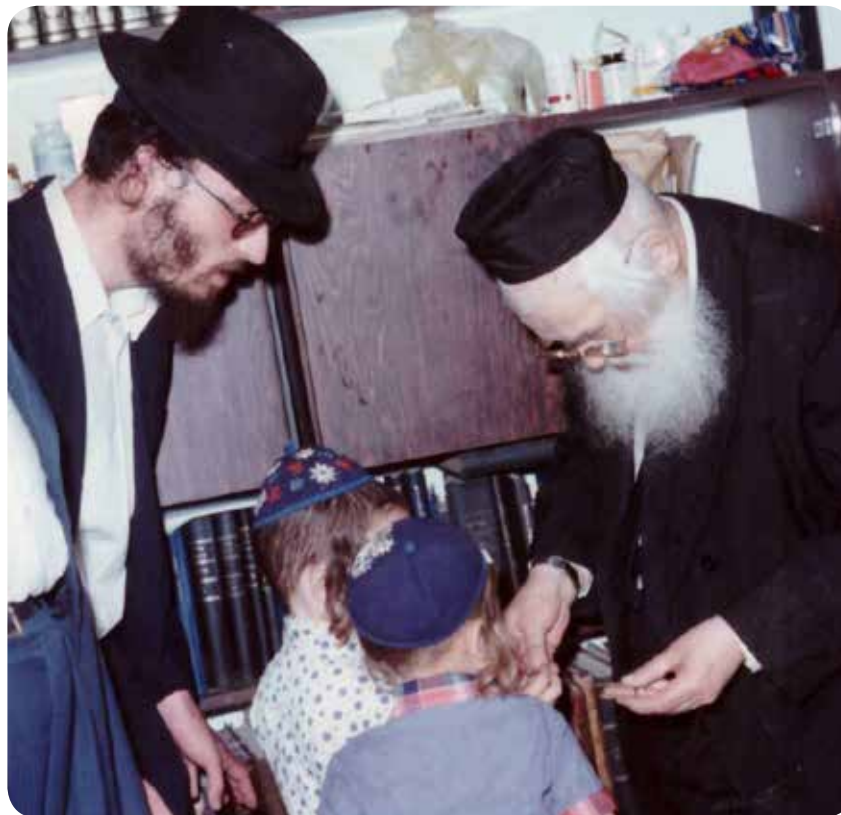
והעת לקצר שאין כאן מקומו, וישמע חכם ויוסף לקח, וידובבו שפתותיו בקבר. אל תקרי מה אלא מאה, וכשראה נעים

וראוי להזכיר כאן דברי האוה"ח הק' שלהי בשלח עה"פ בריפדים - ואין מים,