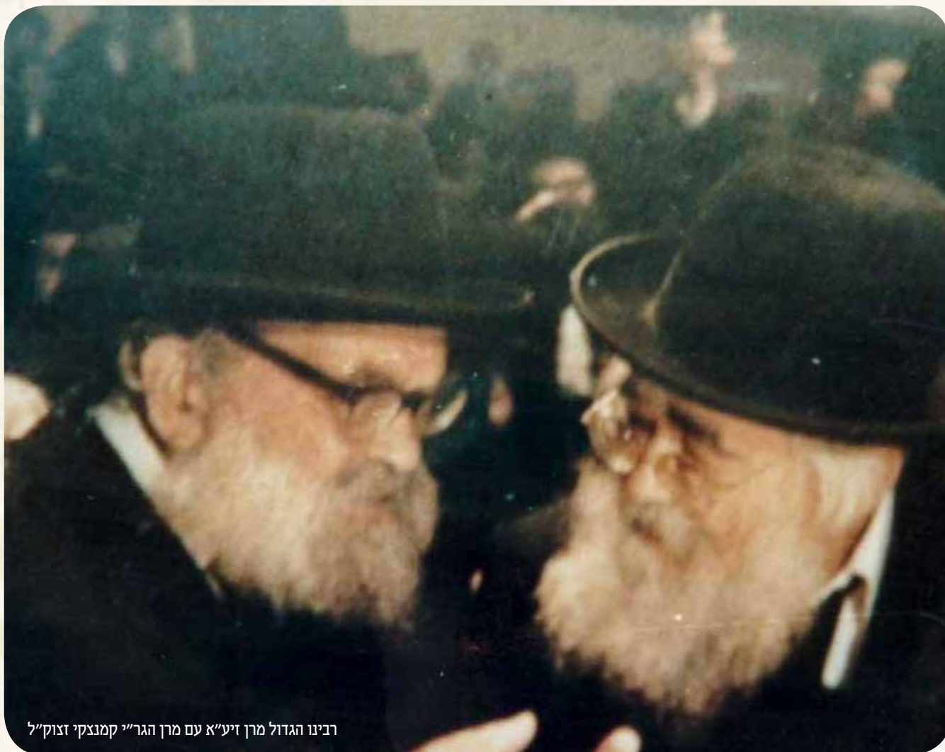
רבינו הגדול מרן זיע"א עם מרן הגר"מ קמנצקי זצוק"ל

התורה בכל אמריקה הגדולה. אין זה סוד שמרן הרב שך זי"ע היה מדברנא דאומתיה וכל מי שביקש לפעול ולו במשהו קטן עבור האידישקייט כאן באמריקה, כמו בכל מקום אחר בעולם, ידע היטב היכן נמצאת הכתובת המתאימה בה יוכל למצוא עזרה וסיוע ככל שיידרש. שלוחותיו וזרועותיו לא פסקו בארץ מגוריו או בארצות המוכרות לו, וכפי שצינתי, כל זה על אף שמעולם לא ביקר כאן."