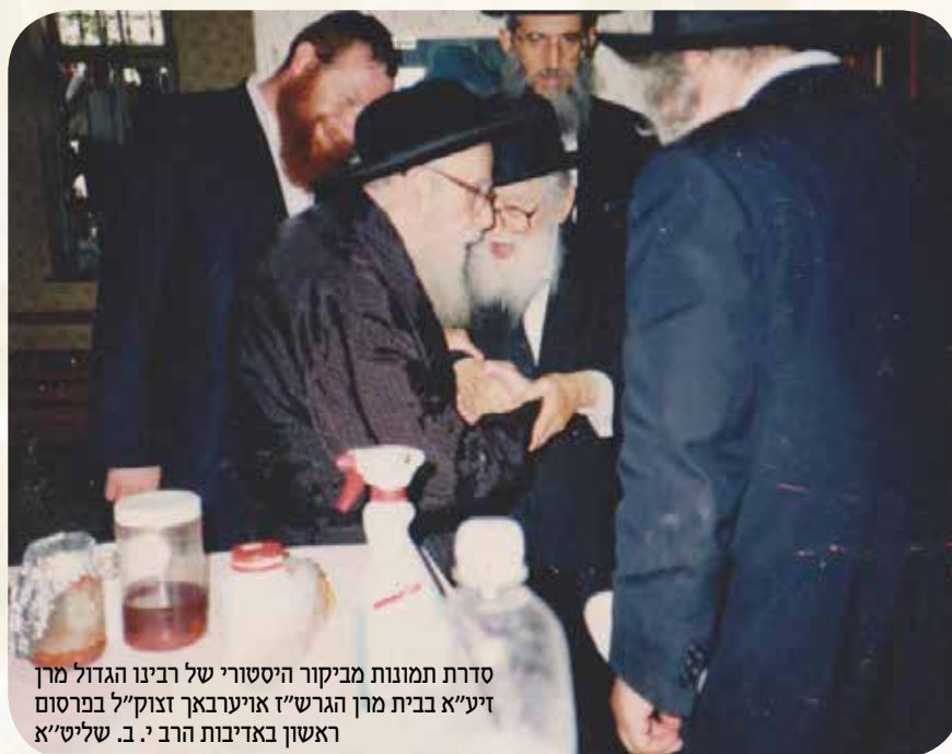
סדרת תמונות מביקור היסטורי של רבינו הגדול מן זיע"א בבית מן הגר"ש אויערבאך זצוק"ל בפרסום ראשון באדיבות הרב י. ב. שליט"א

וכך הוא גם לשון רבינו הרמב"ם הידוע "ולא שבט לוי בלבד, אלא כל איש ואיש מכל באי העולם אשר נדבה רוחו אותו והבינו מדעו להיבדל לעמוד לפני ד' לשרתו ולעובדו לדעה את ד', והלך ישר כמו שעשהו אלוקים", בשיא השלימות, הקב"ה ברא את האדם ישר, ולא צריך לחדש יש מאין ממשהו אחר להוריד כל הקלקולים והעקמומיות מה שהיה.