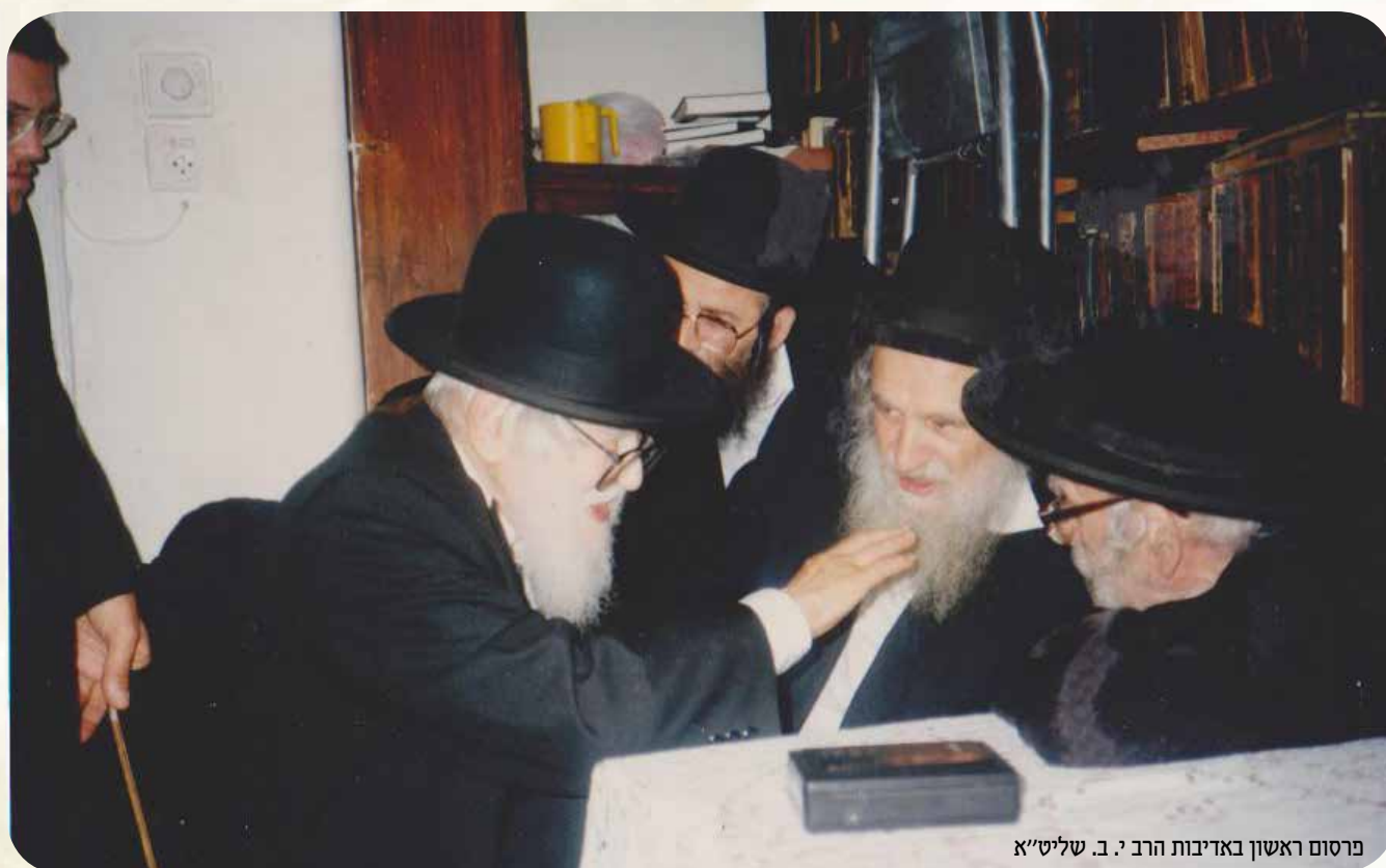
פרסום ראשון באדיבות הרב י. ב. שליט"א

שיהיו הדברים חיים וקיימים בשמחה, להתחזק בימי הנעורים ובימי הזקנה והשיבה שיהיו הדברים שמחים כנתינתן מסיני, ונזכה במהרה לגאולה השלימה, שלא יהיו עוד הנסיונות הקשים, ונגלה כבוד ד' בב"א.