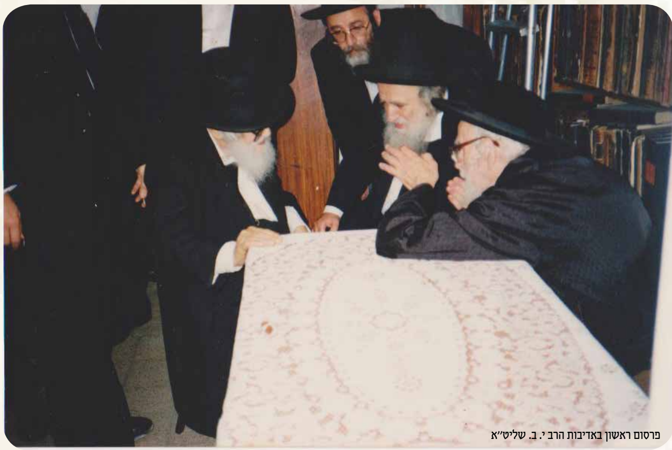
פרסום ראשון באדיבות הרב י. ב. שלישי"א

ואף שהפגם שפגם אדה"ר הוא נורא, והתיקון השלם יהיה רק כאשר יהיה מציאות של "ונגלה כבוד ד'" במהרה בימינו, הרי שהמציאות של "עשה את האדם ישר" לא נמחקה ח"ו, ויש בזה דרגות לאין קץ. ואת זה התחילו האבות לתקן, כאשר עשה את האלוקים ישר בלי חשבונות ועקמומיות, "ישרים" זה התואר שנתנו להם, והחיוב של כל אדם לומר "מתי יגיעו" זה להגיע לישרות, כאשר צוה ד', "פיקודי ד' ישרים משמחי לב" - משמחי לב ממש.