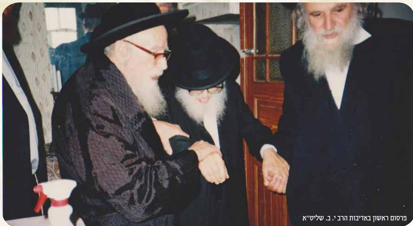
פרסום ראשון באדיבות הרב י. ב. שליט"א

אינני מחדש דבר, רק כפי שאמרתי צריכים להוציא את הדברים בפה, "חיים הם למוציאיהם", כך חיו וגדלו גדולי ישראל שבכל דור ודור, לחיות את הדברים ולא