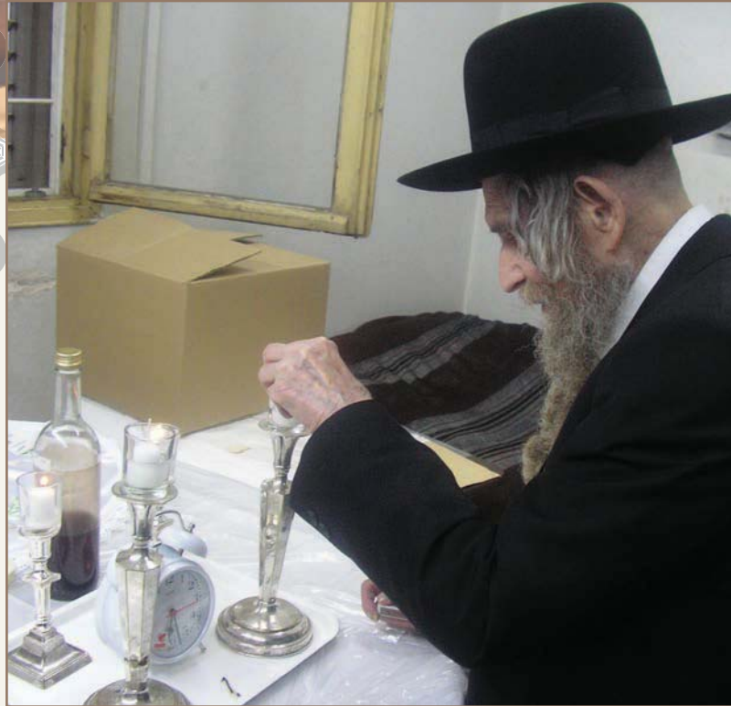
עם כניסת השבת

אמר לו מרן: אדרבה ואדרבה. מרן ה'חתם סופר' שידע את המשמעות של חטא ויודע כמה הוא פוגם וכו', דווקא מרן ה'חתם סופר'. ככל שהארם גדול יותר הוא מפחד עוד יותר. 'אנשים של מנחה מעריב' לא יתבעו מהם כמעט... כי אדרבה, מי שגדול תובעים ממנו יותר. אחד הנוכחים שאל: "אם כן אולי כדאי לא להיות אדם גדול"... רבינו הביט עליו ואמר "ואולי כדאי להיות בהמה או תרנגול?"