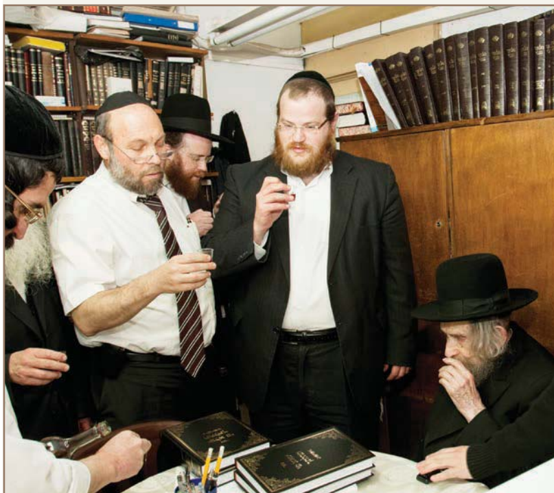
במעונו בשתיית "לחיים" עם הגיע כרך חדש של "אילת השחר" על הש"ס ממכבש הדפוס

עמד פעם בליל שבת על השולחן שעון גדול ששומעים את תקתוק השניות. הוא אמר אני רוצה להגיד לך דבר שאני חושב