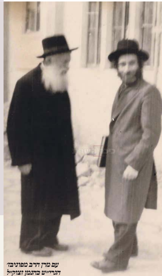
עם מרן הרב מפוניבז' הגר"ש בהנמן זצוק"ל

הכולל התחלק לשתי קבוצות. הייתה קבוצה שלמדה את המסכת בצורה ישיבתית ולמדו בה האברכים המתאימים לסגנון זה כמו הגר"ב פינס זצ"ל ועוד. קבוצה שנייה למדה את המסכת בצורה יותר הלכתית ובקבוצה זו היה הגר"מ זכריש זצ"ל הגר"ב פלמן זצ"ל