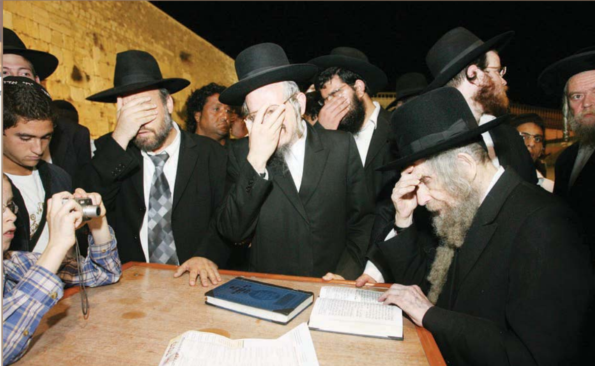
ליבם של ישראל. בכותל המערבי

זכורני שהלך לנחם את בית הרב זלושינסקי שנפטר מתוך שנתו בפתאומיות, כשחזר מהניחום אמר בהתפעלות שהם סיפרו שהיה לנפטר מנהג להגיד וידוי לפני השינה: "איזה חכם הוא היה להגיד וידוי! והסביר שהרי זה נצח נצחים כי בלי וידוי ועם וידוי זה הברל שאין לתאר. תתארו לכם שהוא לא היה עושה את זה, וחזר על כך בערגה ובשמחה. גם הוא נהג בשני וחמישי שאומרים במניין שלו י"ג מידות עם וידוי ואח"כ 'והוא רחום'. אתם מבינים, באותו ליל שבת הוא לא יכול היה להירגע שבני אדם לא יכולים להתכונן כראוי.