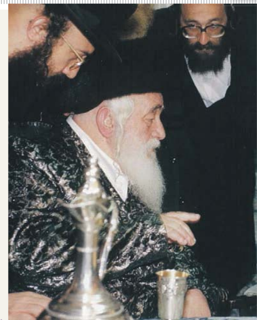
עם ב"ק האדמו"ר מבעלזא שליט"א