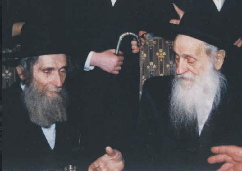
עם ב"ק האדמו"ר מסאטמר זצוק"ל