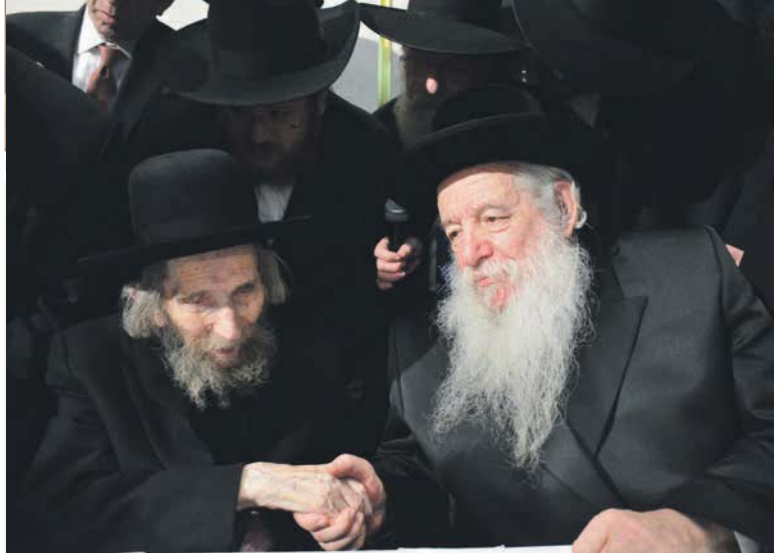
עם ב"ק האדמו"ר מונובומינסק שליט"א