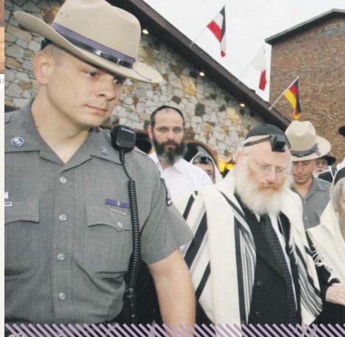
בבואו לבנם "תורה ומסורה" בארה"ב