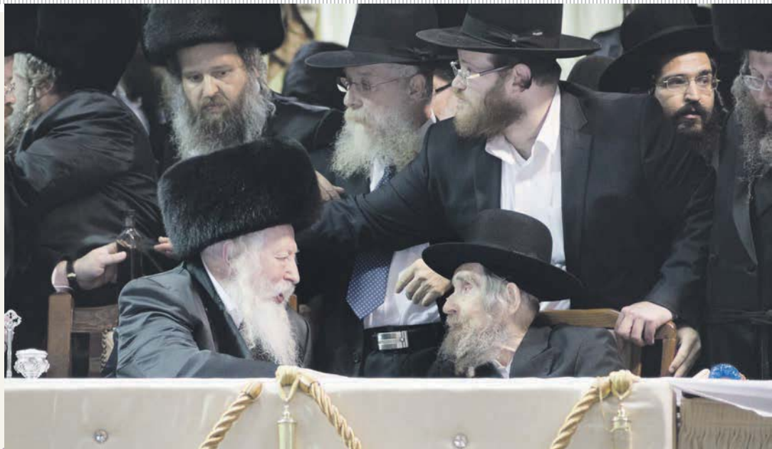
עם ב"ק האדמו"ר מגור שליט"א