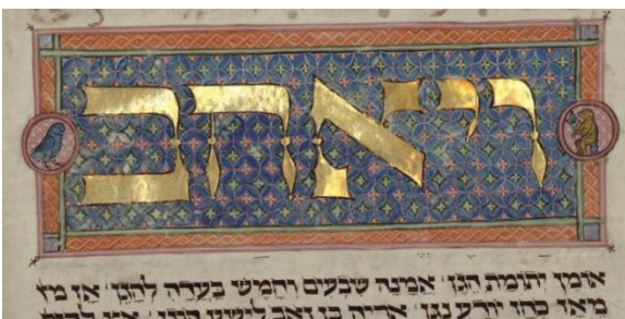
תחילת הקרובה מתוך מחזור נירנברג