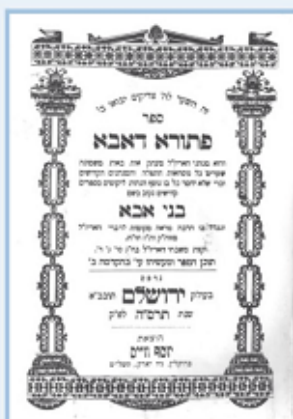
שער הספר "פתורא דאבא"

מחבר הספרים "פתורא דאבא" מנהגי האר"י ו"מאורי ציון"