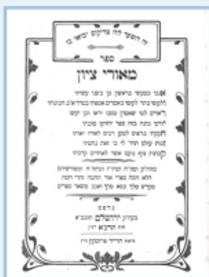
שער הספר "מאורי ציון"