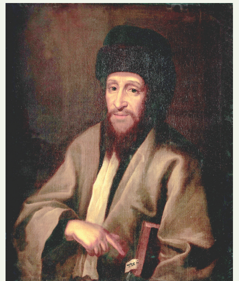
תואר פני קדוש בעל ה"חכם צבי" זי"ע

"והיה צר לי על אלו שלא ידעו מי המה אבותיהם, ואף העיר על כך כמה פעמים, ואם ידעו שהם נכדי איזה גאון או צדיק, ולא ידעו כיצד, היה מעיר על כך שזה אינו נכון. כמה וכמה פעמים הייתי נוכח, כשהיה שואל לנכדי גדולי וצדיקי ומנהיגי הדורות, האם הם יודעים איך הם נכדיו, מאיזה בן או