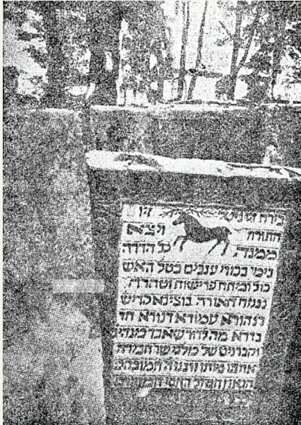
מצבת בעל חכם צבי זי”ע בלבוב

כ”ח — תוספת לגליון המודיע ה’ באייר תשע”ח