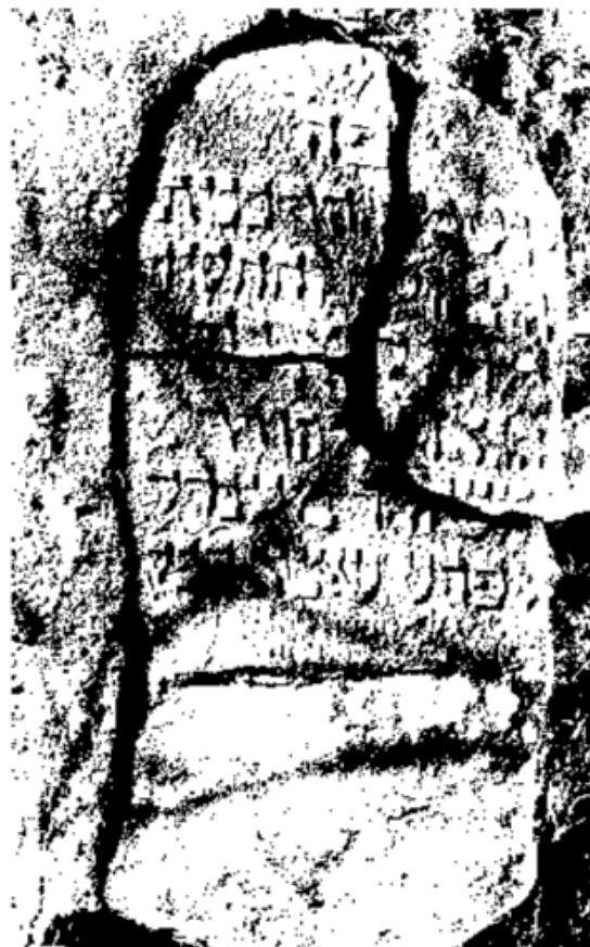
מצבת הרבנית מ' ליא [לאה] ע"ה בתו של רבינו