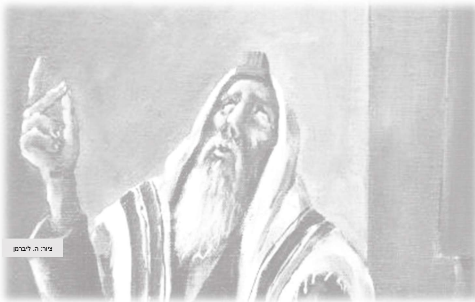
צוה: ה. ליברמן

וי, וי, כמה הרפתקאות עדו עלי עד שהבנתי זאת, עד שר' פיניע הלך לעולמו, ועד שבית המדרש בקארלין נשרף או נהרס או עלה בלהבות כמו כל תושבי קארלין