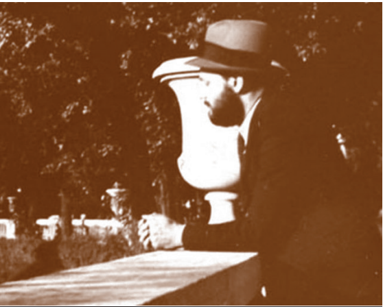
כ"ק האדמו"ר מליובאוויטש זי"ע בצרפת בשנים הון

בשנת תשל"ה, כיהן כרבה של קהילת אהבת אחים בניו ג'רסי.