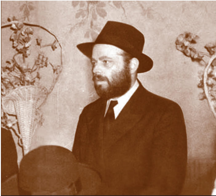
כ"ק האדמו"ר מליובאוויטש זי"ע בצרפת בשנים ההן

חברי הועד זנחו את עסקיהם הפרטיים, כדי לעזור למסכנים הללו, וכן דאגו לאלפי אנשים להשיג מסמכים לשהיה חוקית בצרפת ובאי-טליה. בתקופת הכיבוש והשלטון האיטלקי בחלקים נרחבים בדרום צרפת, הנפיקה קהילת "עזרת אחים" מסמכים עם החותמת שלה, ששימשו מעין תעודת זהות, ובעיני כוחות הכיבוש האיטלקי היה זה מסמך רשמי המקובל