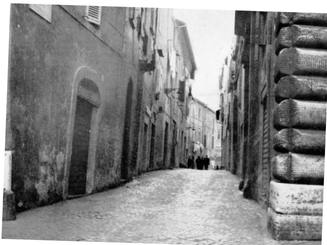
הגיטו היהודי ברומא