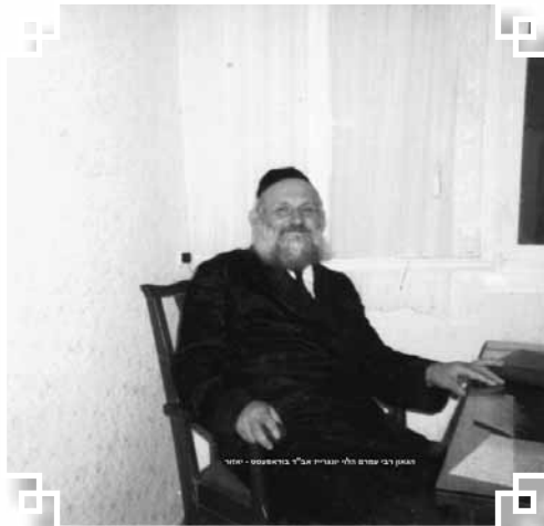
רבינו זצ"ל בחדר לימודו

מפיק מרגליות הפיח בהם רוח חיים והרביץ תורה ובפירות היתה לשם דבר ודרשותיו בשבת שובה ושבח הגדול בביהמ"ד הגדול 'קאוינצי שוהל' שמאות בני אדם מילאו וגדשו את היכל הביהמ"ד על כל גדותיו לשמוע מנועם דבריו אשר הרצק חן בשפתותיו, וכן תיקן הרבה דברים בעיר בפרט בעניני כשרות ועוד וכדרך אבותיו הקדושים