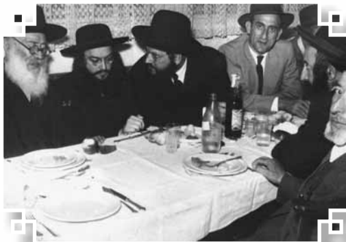
רבינו (במרכז התמונה) בצעירותו בסוד שיה עם הגה"ק מהר"ם דושינסקי זצ"ל גאב"ד ירושלים (מי שיש לו מידע על שאר האנשים בתמונה נא להודיענו)