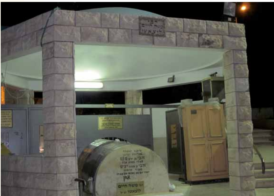
יצירת מופת. ציונו הק' של הרמח"ל

ה"דיבור" הבא, הרביעי במערכה זו, מציג חילופי דברים בין יושר לשני רעיו – שכל וסבלנות, המשקפים את המצב הנוכחי בעליה מנקודת ראותם. מפאת אורכו והתוכן הרב שהוא מכיל, נותיר אותו למאמרנו הבא. ■