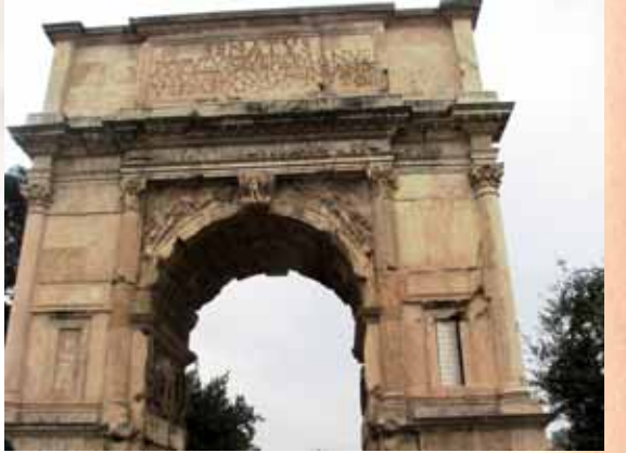
לשפוט את הר עשו. שער טיטוס