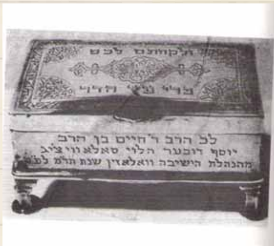
קופסת האתרוג שקיבל רבינו מהנהלת ישיבת ואלז'ין

כמה בריסקאית היא קושיה זו. והתירוץ, הרבה יותר: "במקום להתפתל בשלושה תירוצים דחוקים, אפשר לענות בצורה פשוטה הרבה יותר ולקבוע: האדם הזה הוא שוטה! שוטה מובהק!"