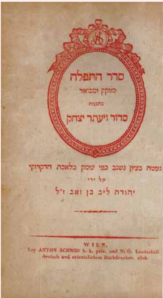
סדר התפילה "מזוקק ומבואר". סדר תפילה עם הערותיו של יהודה ליב בן זאב שנדפס אחרי פטירתו

אחרי מיתתו נדפס ספר שחיבר, סדר התפילה מזוקק ומבואר שנקרא גם בשם 'תפלה זכה' (ראה צילום השער). בספר הזה