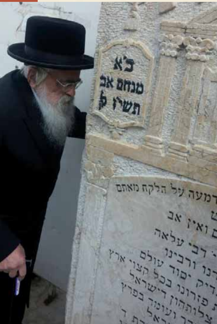
"אגודת ישראל דא איז אזוי ווי די ארטאדאקסן אינדערהיים". הרה"ח ר' זלמן על ציון מרן זי"ע

"ר' זלמן האט געהאט א גרויסע חביבות ביים פעטער זכרוננו לברכה" העיד כ"ק מרן אדמו"ר שליט"א מבעלזא.