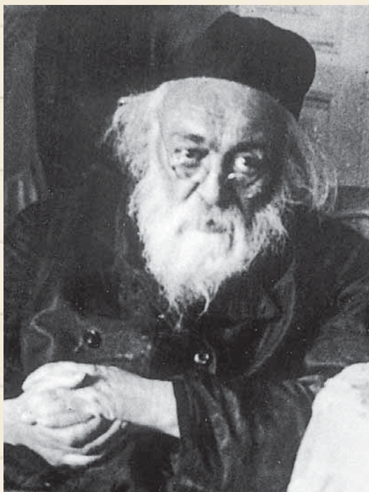
צורת קדשו של רבינו

האמתות הרבה וההגיוניות הגאונות שליוותה כל פשט עיוני פשוט מבית מדרשו של רבנו, הביאו לידי כך שקשה מאוד להפריך חידוש מחידושי של רבנו. פלפול למדני - אפשר להפריך בהבאת מראה מקום סותר; 'דימוי מילתא למילתא' - אפשר לסתור שעה שמציבים מקרה דומה נוסף שמסקנתו ההלכתית שונה. אבל את האמת - אי אפשר להפריך. את ההגיוני