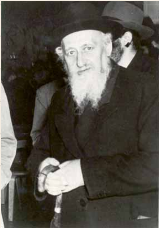
בנו מרן הגר"ז זצ"ל