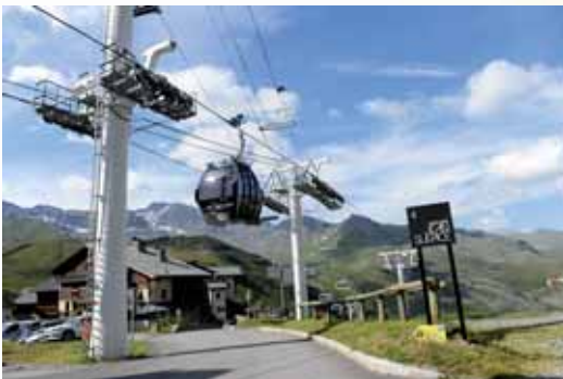
המשל מביע את השקט והשלום

לאחרים, כמובא ב"ספר המשלים" לר"י גיקטיליא (בהקדמה): "והנה שלמה ע"ה כשרצה להראות גודל חכמתו לבני אדם לא יכלו המון העם להשיגה אלא על ידי המשלים שתיקן להם... והמשלים לא נעשו אלא להבין הדברים העמוקים הדקים לאותם שאינם יכולים להבין מרוב עומקם ודקותם, וזה שאמר בראש משלי: 'משלי שלמה בן דוד מלך ישראל', מה כתיב בתריה? 'לדעת חכמה ומוסר להבין אמרי בינה', מה כתיב בתריה? 'לקחת מוסר השכל צדק ומשפט ומשרים', מה כתיב בתריה? 'לתת לפתאים ערמה לנער דעת ומזימה'. בכאן