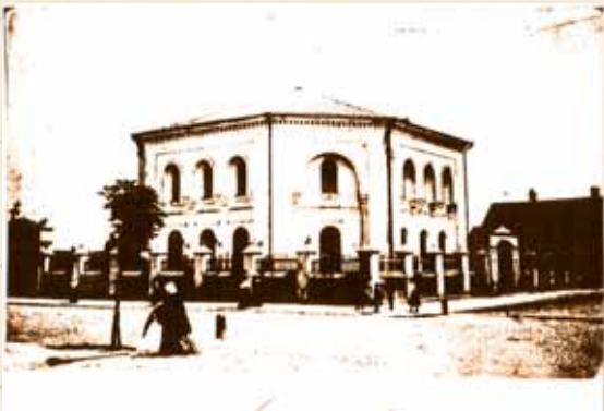
בית הכנסת הגדול בבריסק