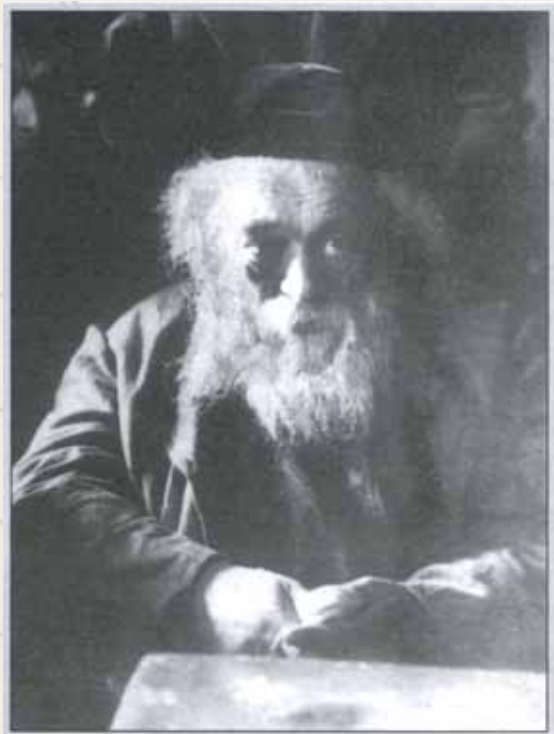
מרן הגר"ח זצ"ל

שבו, וראה שההסבר ישר והגון על פיהם". אולם תשובתו של רבנו מלמדת על הילוך מחשבתו ולא פחות מכך, על שיטת לימודו. רבנו ידע לזהות על הדברים שנאמרו שהם מתחככים בדעת האמת בה הוא ניחן, הוא הרגיש שהדברים אינם נכונים, וממילא ברור היה לו שלא מדובר בדברי התוספות.