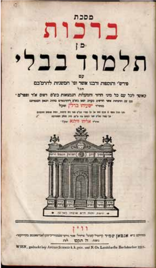
תלמוד בבלי בדפוס שמיר בוינה, עם הגהות הגר"א