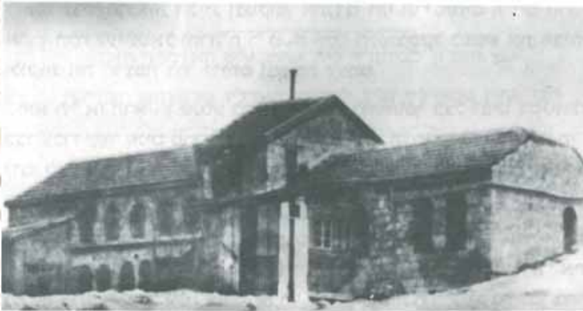
בית הכנסת קארלין בירושלים העתיקה