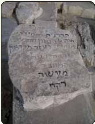
מצבת זוגתו של בעל 'מעשה רוקח' בהר הזיתים

מגדולי עולי ארץ ישראל היה הגה"ק המפורסם רבי אלעזר רוקח זצוק"ל מאמסטרדם, בעל ה'מעשה רוקח', שעלה ארצה בשנת תק"א. לפי המקובל, שנה לאחר עלייתו, בשנת תק"ב, נסתלק רבנו ליישיבה של מעלה.