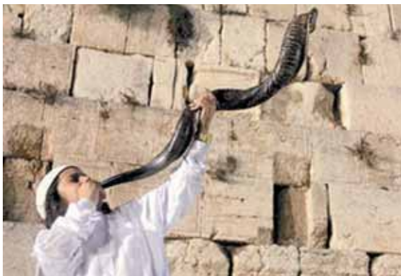
ה' ימלך לעולם ועד