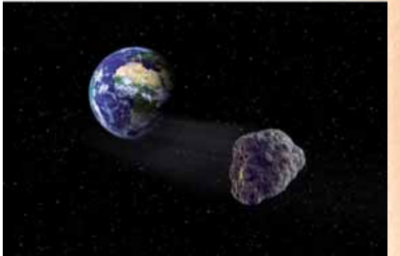
והיה ה' למלך על כל הארץ ביום ההוא יהיה ה' אחד ושמו אחד