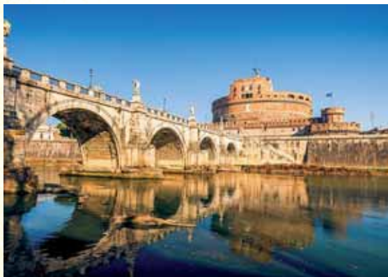
כי לה' המלוכה ומושל בגוים. נהר הטיבר ברומא

"...שיאה של שירת הים הוא הפסוק 'ה' ימלך לעולם ועד', הכרזה שעלתה פה אחד מפי משה ובני ישראל בסיכום השירה, על הנפלאות שעשה ה' עמם. בברכת גאל ישראל בשחרית מוגדרת הכרזה זו כהמלכת ה': 'יחד כולם הודו והמליכו ואמרו: ה' ימלך לעולם ועד'. אולי גם הלשון בערבית 'ומלכותו ברצון קיבלו עליהם', מכוונת כלפי אמירה..."