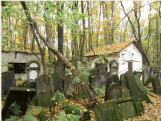
אהל קברי רבינו והנצי"ב בבית הקברות היהודי בוורשא

במצוות ביעור חמץ מוצא רבנו 'צוויי דינים', דין אחד של 'גברא' (-מצוות הביעור הוא שהאדם לא יהיה לו חמץ, ודין של 'חפצא' (-המצווה היא שהחפץ, החמץ, יתבער מן העולם). רבנו מנסה להבין אילו מבין שני הדינים חל במצוות ביעור חמץ ומגיע למסקנה מופלאה, שבעצם מדובר במחלוקת בין רבי יהודה לחכמים הדנים ביניהם מהי הדרך לבער את החמץ. רבי יהודה סובר שמצוות ביעור חמץ היא בשריפה בלבד ואילו חכמים סוברים שביעור חמץ מקיימים בכל דרך ביעור שלא תהיה. רבנו מבאר שרבי יהודה מחייב את שריפת החמץ, מוכרח