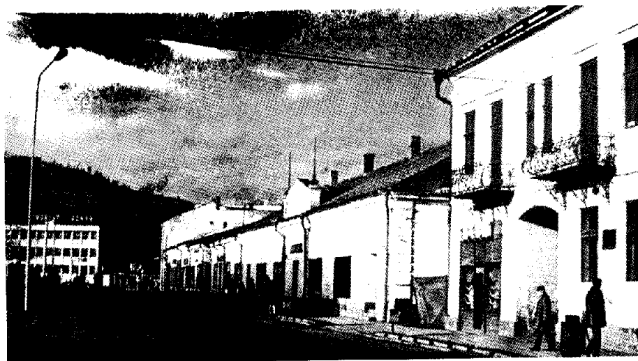
גורא-הומורה: הרחוב הראשי בעיירה

פראבוסלביים שסרבו לקבל על עצמם את הרפורמות בדת שהנהיג הצאר פטר הגדול, נרדפו ברוסיה וברחו לבוקובינה שבשליטת אוסטריה), ארמנים אשר בעבר היוו כנראה קהילה גדולה בעיר אך מספרם הלך והצטמצם, והיו גם משפחות בודדות של סלובאקים, פולנים ואיטלקים.