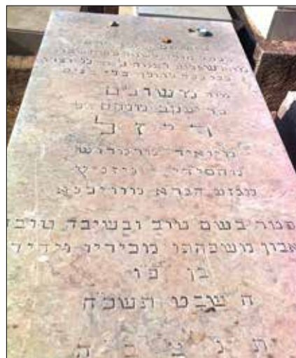
מגזע הגה"א מווילנא - מצבת הגה"ח ר' משולם ריזל ז"ל [נלב"ע בשנת תשכ"ח] בבית החיים זכרון מאיר ב"ב