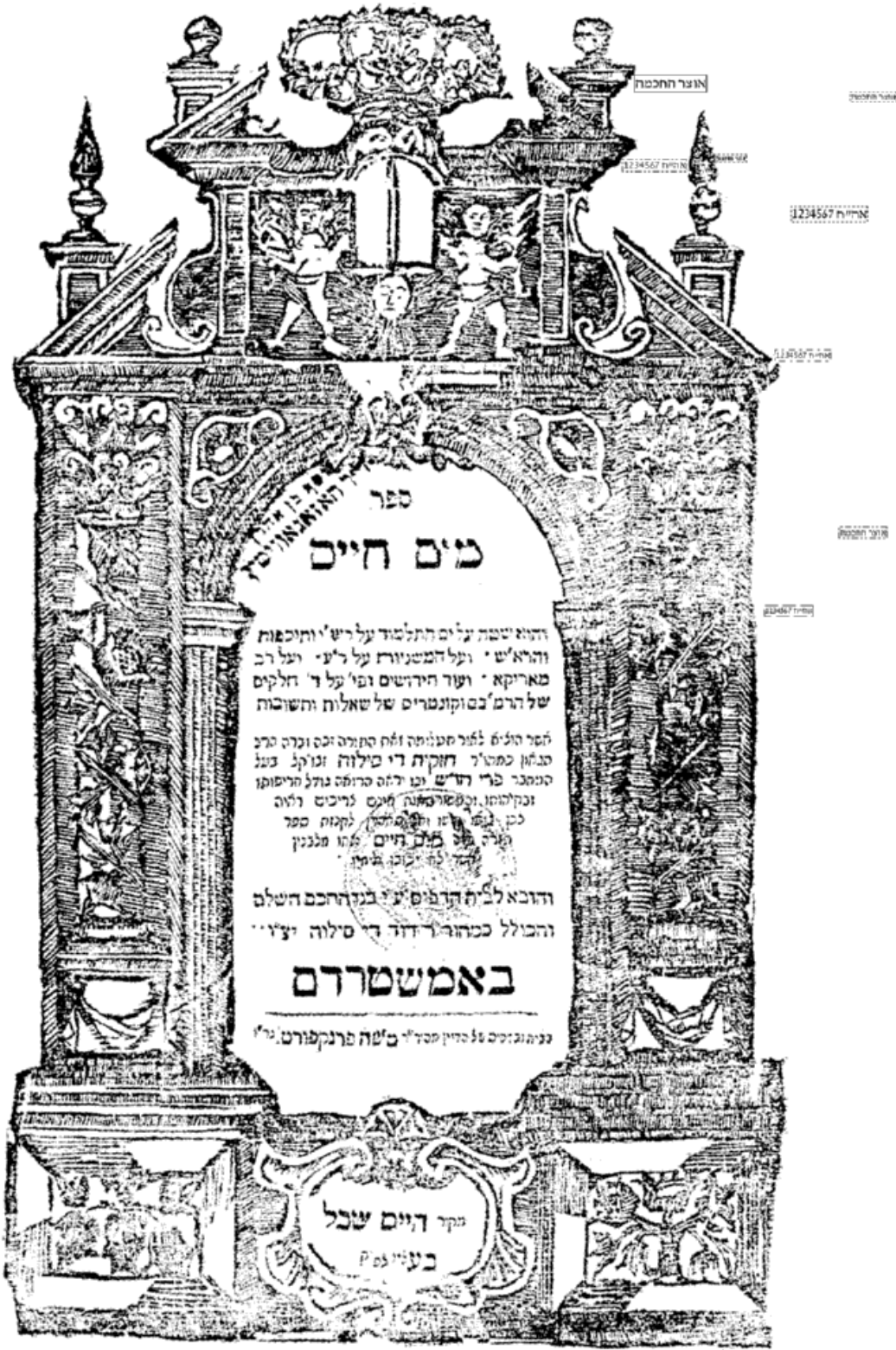
שער ספר "מים חיים", אמשטרדם הת"צ (1730)