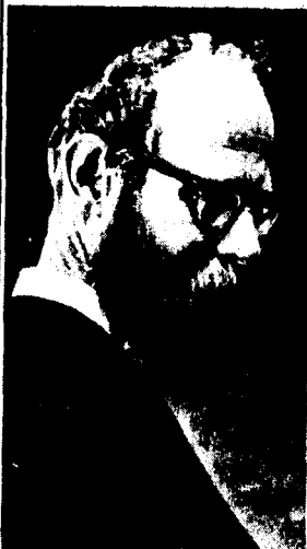
RABBI ADIN STEINSALTZ

filmed will also be included in a by the library. Manuscripts Collection is housed library at the University's Main Avenue in the Washington Heights. The Gottesman Library collections, including 39 Hebrew 500, more than 1,000 manuscripts of Jewish interest. total more than 900,000 volumes in the arts, sciences and