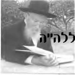
גליון מס' 184