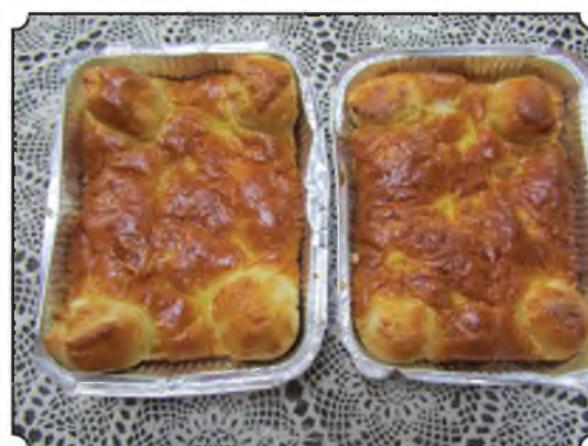
(גודל החלות בתמונה 15x20 ס"מ להמחשה בלבד)

ניתן להזמין דוגמת שתי הלחם אפיה ביתית, (בגודל 15x20 ס"מ) במחיר 5 ש"ח ללחם, עד יום רביעי ב' סיון בטל' 03-6439022 או: 03-6189607. המוצרים בהשגחת הבד"ץ העדה"ח. ללא משלוח. הכמות מצומצמת.