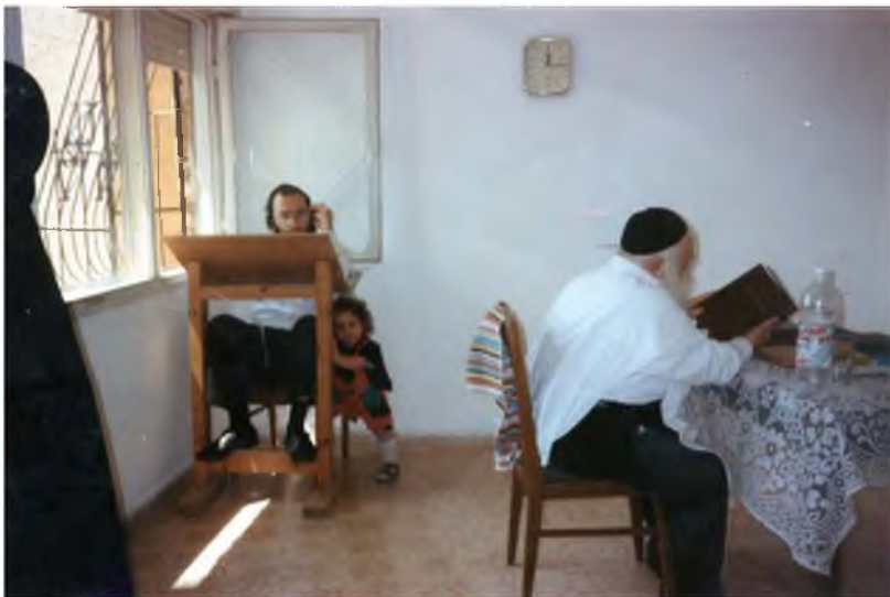
כל הכירות שמורות

ומרן שליט"א עצמו במשך כל השנים עד לפטירת מרן רה"י הגרא"ל שטיינמן זצוק"ל, היה עולה ללמוד בעליית הגג בביתו, ושוקע שם בלימוד בלי מפריעים, ורק בעת הצורך היו נכנסים לשאול שאלות, ובתקופות האחרונות שנתרבו צרכי עמך מקדיש יותר זמן לעשות חסד עם הציבור.