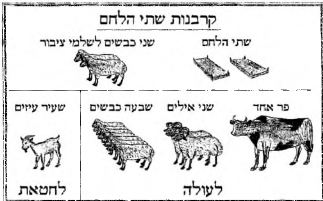
מתוך ספר שיעורים בספר ויקרא

מצוות הבאת שתי הלחם מתחלק לארבעה חלקים: חלק א' - הכנת הסולת. חלק ב' - הכנת הלחמים (בערב יו"ט). חלק ג' - התנופה (ביו"ט). חלק ד' - האכילה (ביו"ט עד חצות ליל מוצאי יו"ט).