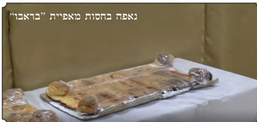
לחם בגודל שבעה טפחים על ארבעה טפחים