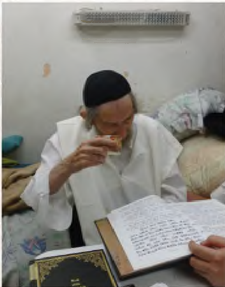
נזיר. מרן מקיים את מנהג הכפרות על הכסף, ערב יום כיפור.

בעשיית במנחה בשבת הגיע לתפילה וביקש מהחזן שיוציאו, כי נסתפק שמא לא אמר כמדומה מי כמוך אף שמן הדין אי"צ לחזור.