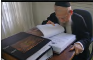
מרן ורבנן שליט"א עם הספר בע"ח אשתקד

שלא מש מעיניהם של גדולי ישראל בימי הרחמים והסליחות