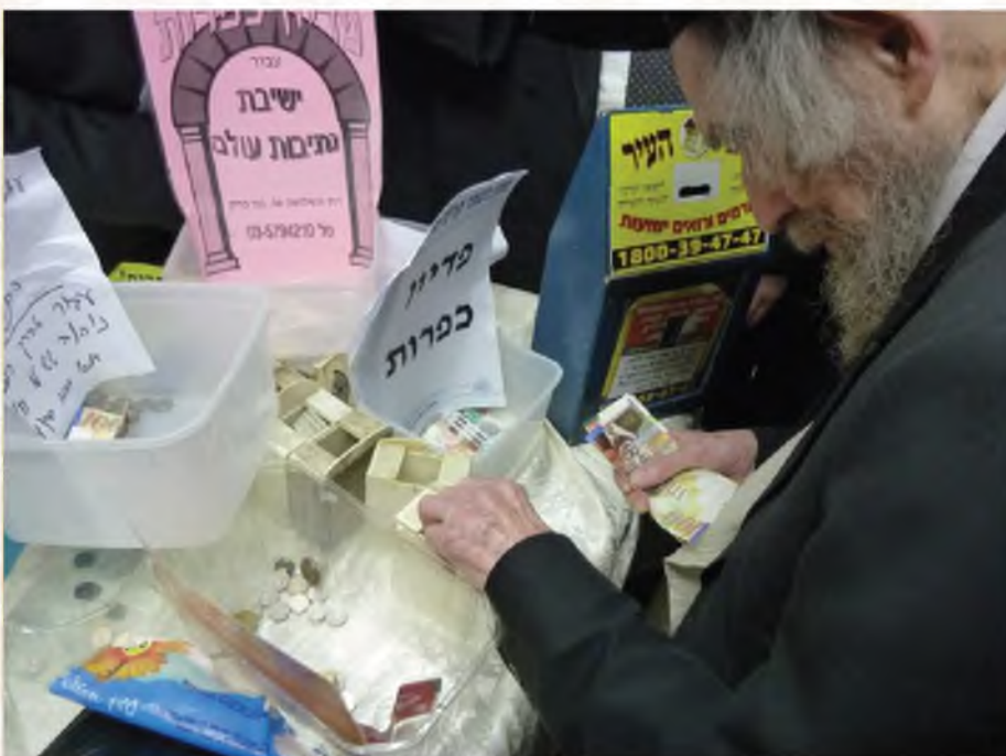
נותן את כספי הכפרות.

השיב לו שמובא בתנא דבי אליהו שהקב"ה מכנים תחת כנפיו גם כאלו שלא שבו בתשובה שלמה. לצערי למרות התשובה הברורה ראש הישיבה לא קיבל אותו הכנסתי את הבחור לישיבה אחרת בה הוא התחזק והתעלה באופן מיוחד אך לאחר תקופה נחלש במקצת בשיחה מלב אל לב שאלתיו מה גרם לחיזוק ומה לחולשה והוא ענה לי כשראיתי עד כמה הגרא"ל שטינמן מבין אותי חשבתי לעצמי אם הוא כך בורא עולם ודאי מבין אותי ומחשבה זו גרמה לי להתחזק מאד הבעיה שלי הייתה שבמקביל לכך חשתי כל הזמן את הכאב הצורב למה ראש הישיבה שלי לא הבין לליבי באותו זמן.