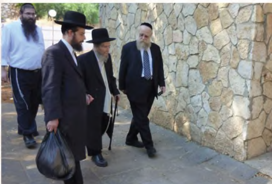
בדרך למקוה בערב יום כפור.

אמר לי רבנו שהדורות חלשים משהיו, ששימת הדגש על הפחד בפני הצעירים עלולה להרחיקם מלשמוע. קיבלתי על עצמי לעשות כדברי הרב וכבר באותה שנה ראיתי עד כמה היו דבריו צודקים ומבינים לנפש האדם.