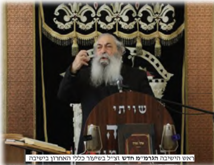
ראש הישיבה הגרמ"מ חדש זצ"ל בשיעור כללי האחרון בישיבה