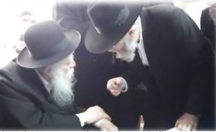
הגר"י ויזל שליט"א משוחח בדבר הלכה עם מרן הגר"ן קרליץ זצ"ל

שהציבור לא יוכל לעמוד בזה. אבל הוא זכה לסייעתא דשמיא והציבור נשמע לפסק הזה. הבנקים חשבו שיעבור זמן קצר והציבור יחזור לעסוק אתם. עברו כמה חדשים והבנקים ראו שהציבור חזק בדעתו, וכולם נכנעו. כל מנהלי הבנקים באו