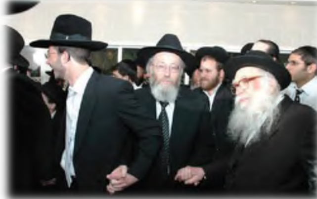
מרן הגר"ן זצ"ל משתתף בשמחת נישואי בנו של הגר"י ויזל שליט"א