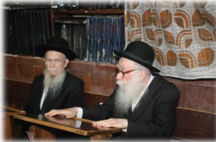
עם יבדלחט"א מרן ראש הישיבה שליט"א בהיכל כולל יחזון איש

חוץ משיעורי ההלכה אמר גם שיעורים בספרי מוסר. ביניהם שיעור מיוחד שבו השתתפו משגיחים של ישיבות גדולות. מצינו היה מספיק לקרוא את דברי חז"ל והקדמונים, ולא מצא צורך להוסיף כלום. אחרי כל משפט הפסיק והתבונן. מצינו לא היה צריך לשום תוספת, כי הדברים היו שלמים ודברו בעד עצמם בלי צורך לתוספת כלשהי. אמנם השומעים שאלו שאלות, ואז הוא הוסיף דברים של חכמה ודעת והבנה במוסר ובנפש האדם.