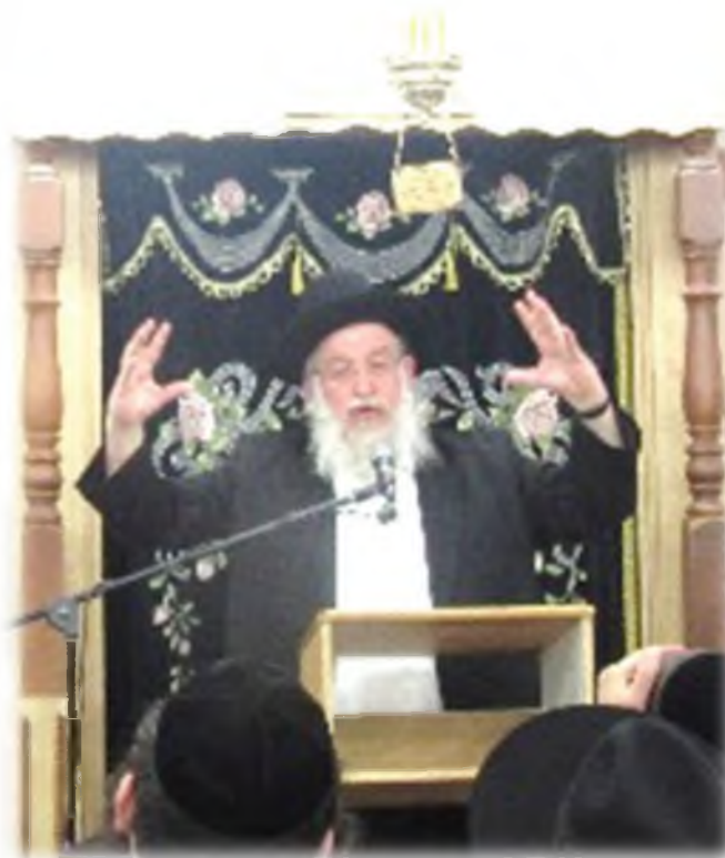
השואל כלפי מעלה.

התשובה הזו היא לא תשובה נקודתית, זו תשובה שמחנכת איך להתנהג ואיך להסתכל על החיים. איך להסתכל מה זה כסף ומה זו פרנסה. כמה אדם צריך לעשות, מה מותר לו לעשות ומה אסור לו. יש פה רשימה של עשרים שלושים שאלות במשך החיים, שהכל טמון באותה תשובה. וכך היתה דרכו שבתשובות שלו, זה לא היה רק תשובות של מורה הוראה, זה היה תשובות של רב שבעצם הוא רואה את הקומה השלמה של האדם, והמטרה שלו היתה לרומם ולהעלות את