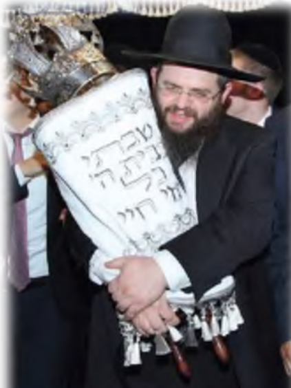
ראש הישיבה הגאון רבי צבי וינפלד שליט"א