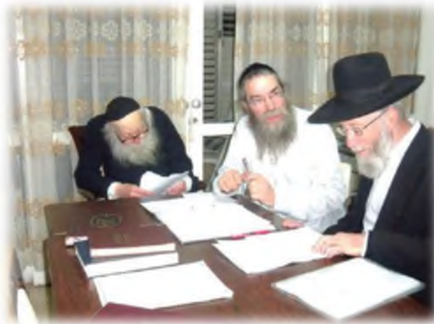
הגר"י ויזל שליט"א בבירור הלכה על שולחנו של מרן זצ"ל