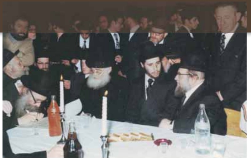
עם רבנו הגדול מרן הגרא"מ שך זצוק"ל בשמחת נישואין. מרן הגר"נ כותב את הכתובה, לימינו נראים הגר"י ניימן זצוק"ל והגר"ש ברסן זצוק"ל

שעה דרך כמה יישובים, והחליט לעלות עליו וכך יגיע ליעדו מהר יותר - וכן הוזה. לאחר מכן אמר לי, שהתפלא לראות כי כמעט איש מהממתינים לא עלה עליו, ואז הבין, כשאדם נאלץ להמתין בתור הוא עושה זאת עבור עצמו, הוא מוכן לבזבז זמן רב לשם כך. אבל המאסף נוסע עבור אחרים למקומות שהוא לא נצרך להם, וזה דבר קשה לאדם לעשות, ולכן הוא אפילו לא מחשב כמה זמן יוכל לחסוך...!!