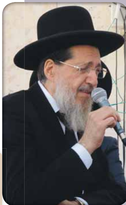
הגר"צ קוק שליט"א

וההערכה ההדדיים ששררו בין אדירי התורה, פוסקי דורנו, מרן רבנו הגרי"ש אלישיב זצוק"ל ומרן הגר"נ קרליץ זצוק"ל