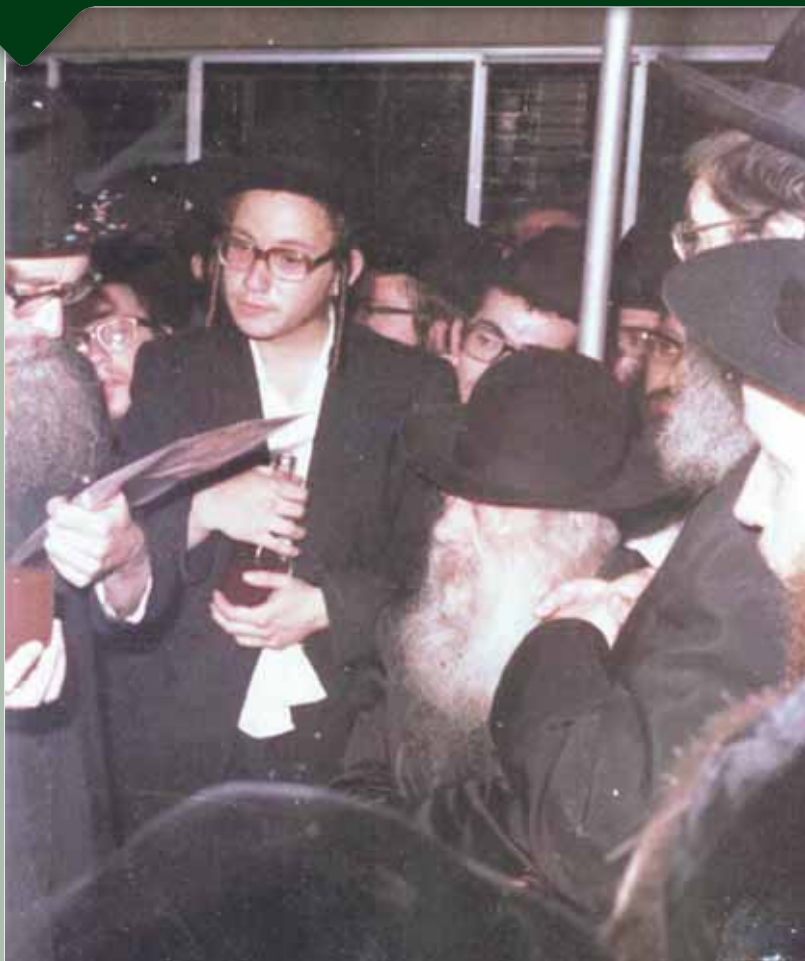
מברך על הכוס תחת החופה. במרכז התמונה נראה מרן הסטייפלר זצוק"ל

לא הייתה לו שום טובת הנאה מההכרעה ושום עניין אישי בפסק. זה הכוח של 'אין לו אלא ד' אלוקיו' וממילא התוצאה המוכתרת היא 'את זהב בסופה'... כך זה בדיני התורה וכך הוא בהנהגת הכלל".