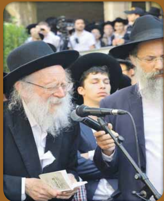
הגר"ש גלאי שליט"א, בבגד קרוע, בקריאת פרקי תהלים בהלוויית מרן הגר"נ קרליץ זצוק"ל

היכולת שלו לחלק את הרגעים בסכינא חריפא הייתה מדהימה עד מאד, וביטאה את השליטה המלאה על הרגשות: שלטון השכל על הרגש באופן נדיר ומיוחד, כחד מקמאי. בהיכלו נחתכו הדברים בסדר ובשלטון ובאופן ברור: עכשיו צריך לעשות את זה, וכעת את זה, ועשה בכל עת את מה שצריך.