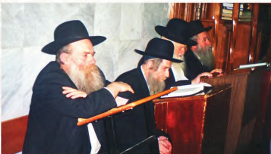
רבינו בהיכל ישיבת תפרח