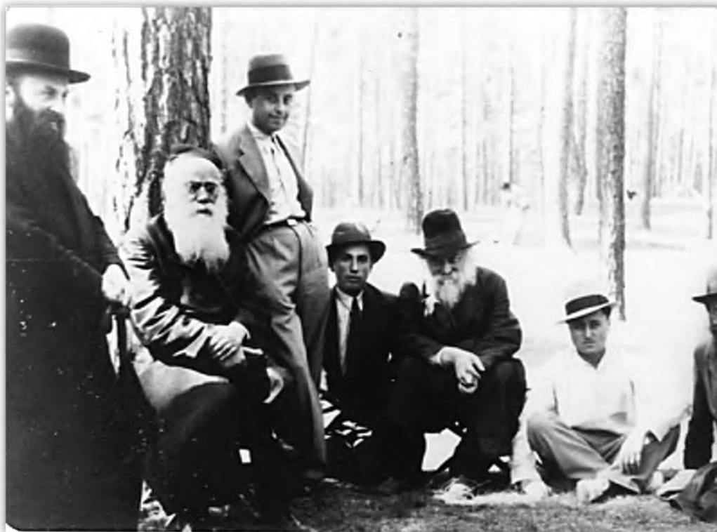
מרן הגאון רבי ברוך בער זצוק"ל עם מרן הגאון רבי שמעון שקופ זצוק"ל

זכורני, עת נדדתי עם אאמו"ר והסבא רבי ברוך בער בבריחתנו מקמניץ לוילנה, והיה לי הזכות לראות את הסבא גם במצב זה תוך כדי תנאי המלחמה ורעמי התותחים שמסביב והמנוסה בדרך המפרכת, והטלטלות העזות, כשהוא חי את הגמ' עם כל המתיקות והרגש, הסבא היה מגיב אך ורק לדברי תורה, עולם הקשיים