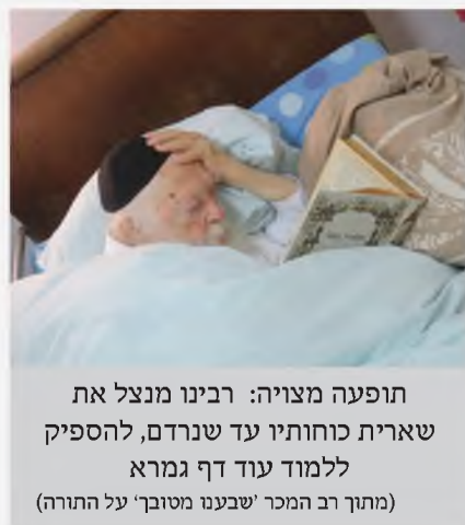
תופעה מצויה: רבינו מנצל את שארית כוחותיו עד שנרדם, להספיק ללמוד עוד דף גמרא (מתוך רב המכר 'שבענו מטובך' על התורה)

חלש והוצרך ללכת לנוח כדי להוסיף כוח, והלך לחדרו לנוח, ואחרי שנשכב ביקש שיביאו לו הגמרא שעסק בה, כדי שבדקות עד שנרדם יתקדם עוד בגמרא, ואכן הוא הספיק ללמוד כמעט דף, עד שחש בעייפות והניח הספר בצד.