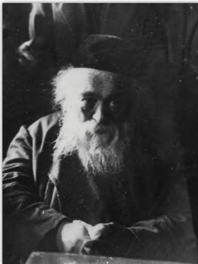
ר' חיים זיע"א

יום שישי בבוקר ה' בכסלו ת"ש, בית מרן הגרב"ד זיע"א ברובע לוקישוק שבוילנא, בחדר הפנימי קודש הקדשים מוטל רבן ומאורן של ישראל על מיטתו, מצבו הולך ומחמיר משעה לשעה, השעות האחרונות של חיים שכולו יגיעה ועמלות בתורה, התלמידים מסובבים את מיטתו, ואז לוחש רבי ברוך בער לסובביו