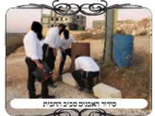
סיור ראשונים סביב החבית

במהלך הסיור למדנו שסלע קבוע נחשב קרקע, אלא שבכל זאת יש לחלק בין סלע שיש על גביו שטח ד' על ד' טפחים, בשיעור קרקע המינימלית של רשות, ואז צריך חלל י' מעליו, ואם אין חלל י' נפסלת צוה"פ, משא"כ סלע שאין עליו שטח ד' על ד' טפחים, כגון שהוא משופע כולו, אין לו שיעור קרקע, ואמנם הוא קבוע, אבל אינו קרקע אלא מחיצה, ושיעור גובה הצוה"פ אינו מתייחס לראש המחיצה אלא לגובה הקרקע, [ובזה יש לדמות לדברי החזו"א (סי' ע"ה ס"ק י"ט)] בדניי מחצלת שחוסמת מקצת מהפתח, ויש לעיין ולפלפל בזה.