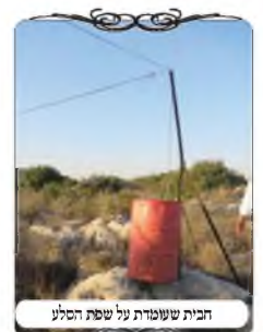
חבית שעומדת על שפת הסלע

דבר נוסף שהיה לאברכים ללמוד באותו סיור, היה מקום אחד שקשרו את החוט לברזל שאינו ראוי לשמש עוד, ולכן העמידו לפניו חבית, שהחבית תשמש ללחי. האברכים הבחינו מיד שיש כאן בעיה גדולה, משום שהחבית עמדה על שפת הסלע, והחוט הולך לכיון של מרגלות הסלע, ויוצא שהלחי עומד בגובה מעל קרקע הרשות, ומתחיל מעל ג' טפחים משטח הפתח. בדן זה מבואר בחזו"א (סי' ע"ה ס"ק י"ח) שהעמוד אינו יכול להתחיל על מדרגה, [והטעם משום דין מחיצה תלויה. ואע"פ שאין מקום לגדיים לעבור תחת העמוד, לומד החזו"א שגם בזה יש את הפסול של תלויה. ואחד ההסברים בדבריו, כי שיעור המחיצה נמדד לפי הקרקע, וכשהעמוד מתחיל בגובה מחשבים רק את החלק שבתוך י' טפחים לקרקע, וא"כ יש רק שבעה טפחים עמוד, ומה שממשיך בגובה אינו מצטרף].