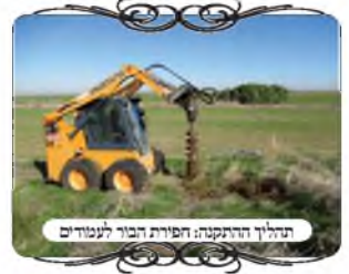
תהליך ההתקנה: חפירת הבור לעמודים

בשבוע זה זכינו בס"ד להעמיד עוד עירוב כשר לשכונה בדרום, שגרים בה תושבים דתיים, ולא היה בה עירוב כלל. עקב הנחיצות של העירוב במקום זה, יצאנו במבצע להקים את כל העירוב תוך מספר ימים, למקום הובא טרקטור עם מחפרון, שיעשה את חפירת הבורות במהירות ויקצר את התהליך כמו"כ ליציקת הבטון שנעשית בדרך כלל בצורה ידנית או בעזרת מערבל קטן לכל עמוד בפני עצמו, במקרה זה הביאו משאית בטון כדי לעשות את כל יציקת העמודים באותו יום. ובס"ד העמידו עשרות עמודים באותו יום.