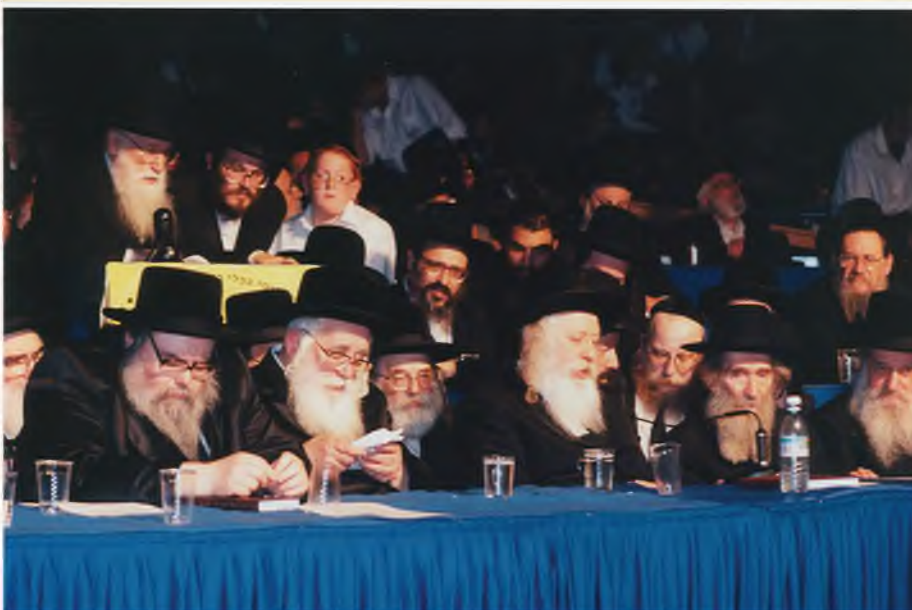
רבנו בסיום הש"ס באלול תשנ"ז ביד אליהו

והיה רגיל רבנו להורות בעת שעושים סיום הש"ס של הדף היומי שיעשו בעסק גדול, כדי שיתרבו הלומדים העוסקים לפרנסתם בלימוד הדף היומי.