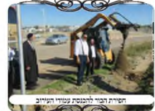
חפירת הבור להנחת עמודי העירוב

ממקרה זה ומעוד עשרות מקומות אנו לומדים שאין כזה כלל, ולא בכל מקום יש עירוב, וגם במקום דתי צריך לדעת שגם זה צריך דרישה של הציבור, זה לא נעשה מאליו. במקרה זה מדובר בהרחבה של ישוב, שנבנו עוד עשרות דירות, דאגו לעשות להם כבישים, מדרכות, תאורה ושאר התשתיות, אבל העירוב נותר בהמלצה בלבד. למרות שיש מועצה דתית אזורית, וגם יש ביישוב הרבה שומרי תורה ומצוות, בכל זאת עברו כמה חודשים מזמן שנכנסו לגור, ועדיין לא נעשה שום דבר בענין. אחד מהתושבים הדתיים פנה למועצה ולועד הישוב, ונדנד להם הרבה פעמים, ואז התחילו הדברים לזוז. גם אח"כ, בכל שלב הוא היה צריך להזכיר ולבקש ושוב ושוב, וגם ראש ועד הישוב שהוא אדם ירא שמים פנה אל המועצה שוב ושוב, וכל שלב היה צריך לפנות מחדש ולבקש מחדש. עד שבס"ד הגיע לידינו אישור ביצוע העבודה, שנעשתה בשבוע זה.