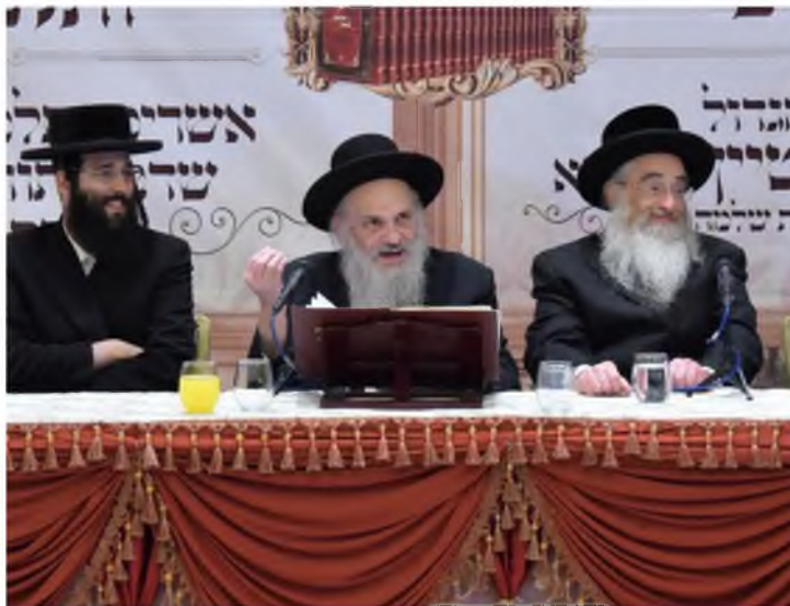
ואח"כ נהיה כשר.

אברך נוסף טוען למקרה נוסף, בדין אותו ואת בנו, שביום ששחטו אותו בנו אסור, ולמחר יותר. מרן ראש הישיבה שליט"א מקבל את דבריו, ואברך אחר מוסיף מיניה וביה, כל קרבן שהוא מחוסר זמן, בתחילה הוא פסול,