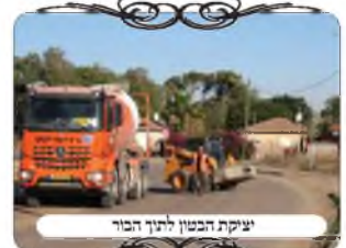
יציקת הבטון לתוך הבור

במקרה זה ובעוד מקומות דומים, אנו רואים את אחת מהסיבות שלא לסמוך סתם שיש עירוב, וגם מי שסבור להקל, צריך לדעת שעדיין יש מקומות שבהם אין עירוב כלל. במקרה זה מדובר בשכונה חדשה, אבל יש גם מקומות וותיקים שאין להם עירוב, כל מקום והסיבה שלו. כעת יש כמה ישובים בדרום שהרב ביישוב אומר למי ששואל שאין עירוב ביישוב. וגרים בהם עשרות אנשים שבדברים אחרים הם שומרי שבת, ובנושא הטלטול לצערינו ה' ירחם עוברים בשגגה מידי שבת עשרות פעמים, כי לא מבינים את עוצמת האיסור, שלא לקחת שום חפץ, אפילו לא לחצר [שברוב המקומות אינה מוקפת בפנ"ע]. לא להזיז שום כסא ועגלה בחצר, ועוד עשרות דברים שאנשים שהורגלו לטלטל, אינם שמים לב למעשיהם בנושא זה.