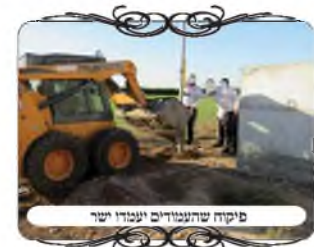
פיקוח שהעמודים יעמודו ישר

בגליון הקודם הבאנו מקרה חמור של ישוב שסמכו על הנחל כמחיצה לעירוב, והיו בו מגוון של בעיות, כגון שאין חיבור משפתו אל המשך המחיצות, וכן פירצת הגשר שעובר מעליו, וכן מצוי שיש קטע לאורך התעלה שהדופן של התעלה אינה משופעת כ"כ בשיעור תל המתלקט ונחשב פירצה הפוסלת. לכן בעירוב החדש וכן ברוב העירובים העירוניים לא מסתמכים על התעלה למחיצות העירוב, אלא עושים שורה של צורות הפתח שהם נחשבים למחיצה, ולא מתחשבים בתעלה. ואז הבעיה היא אחרת, שצריך לעבור עם המחיצות מעל התעלה, כדי לכלול גם את המשך הישוב שאחרי התעלה, ובוזה נתקלים בשאלה הלכתית כיון שלתעלה יש דפנות, א"כ הם יכולים לפסול את צורת הפתח העוברת מעליה.