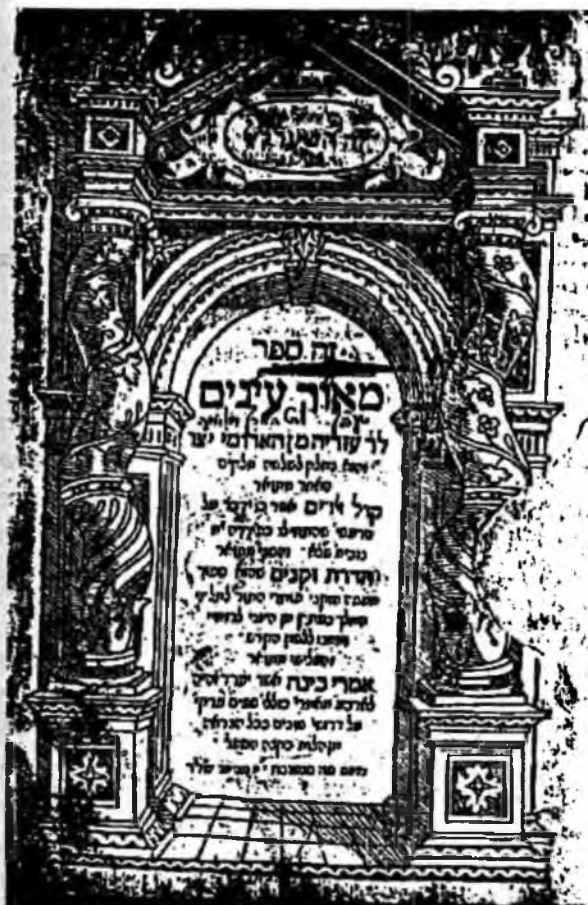
שער הספר מאור עינים בחתימת הרעב"ץ עליו

משכבי עצמו נהרסו, באופן כי אם נמצאנו אז בחדר ההוא כמנהגנו הן זמן שכיבה הן זמן קימה, היה בלי ספק כותת את כלנו טחון, ונשמה ח"ו לא נותרה באחד ממנו, אולם