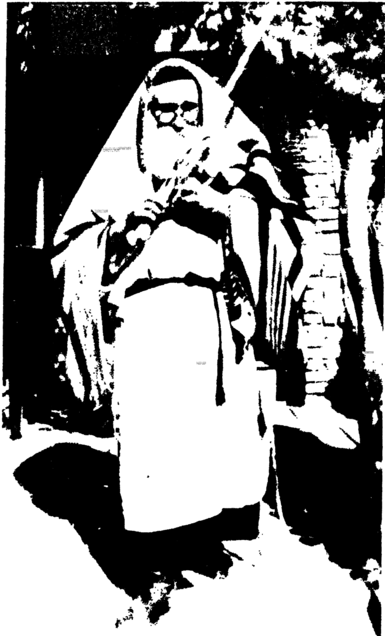
עם „ארבעת המינים“ בחג הסוכות