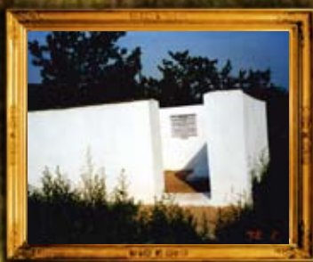
קמניקה מולדביה: נכדי הרב מאפטא