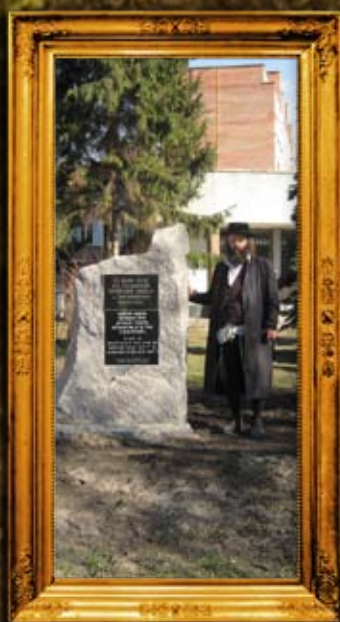
המלניצקי: ציון בית החיים העתיק