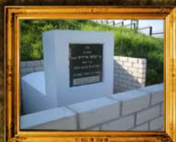
קורדיץ: ציון בעל ברית כהונת עולם