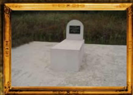
ביאלה דבסקא - פולין: מוצבת הרה"ק רבי אברהם משה מפשיסחא