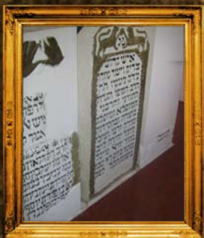
פולנאה: המצבות המקוריות