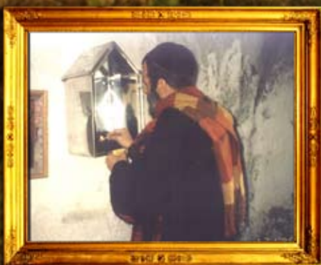
נר תמיד על ציון אהרן הכהן בירדן