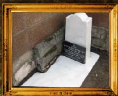
אלמא-אטא - קזחסטן: איתור ושיפוץ מצבת הרה"ק ר' מרדכי ב"ד שלמה מסוורין