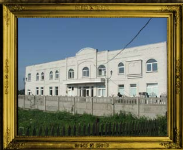
בעלז: בניית בית הכנסת אורחים בבעלז עבור מרכז עולמי בעלזא