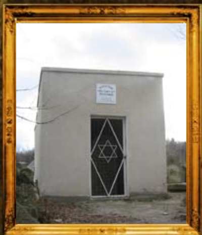
נדבורנה: אוהל הרה"ק רבי ישכר מנדבורנא