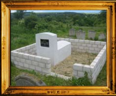
וורחיבקה: ציון הרה"ק ר' שמערייל וורחיבקער תלמיד הבעשט