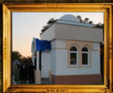
שפיטובקה: אהל הרה"ק רבי פנחס מקורדיץ - וגידור ביה"ח