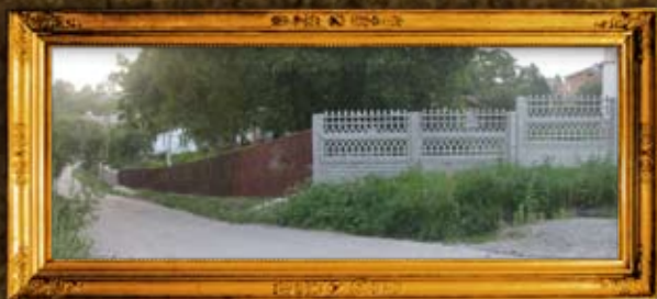
שפיטובקה: גידור בית החיים