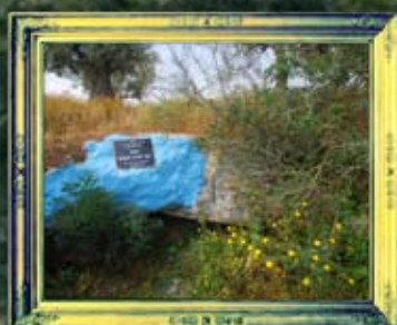
ציפורי - אשת רבי יהודה הנשיא