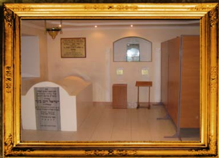
וולדיניק: פנים אהל ועזרת הנשים