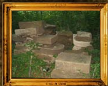
אוסטראה. עשרות מוצבות הוחזרו לבית החיים בעקבות פעילות האגודה