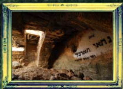
ארבל - ניתאי הארכלי