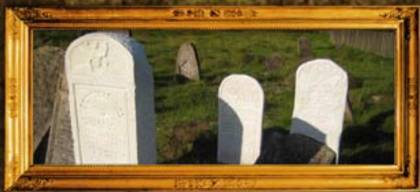
לינסק: ציון אשת הרה"ק רבי מרדכי מלינסקי זע"ד