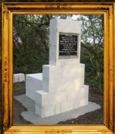
ציזיקוב: ציון וסימון בית הקברות