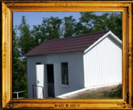
פאברייטש: אוהל הרה"ק רבי שלום שכנא מפאברייטש