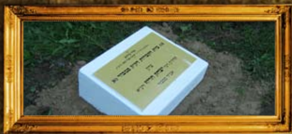
סמבור: בית הקברות הישן