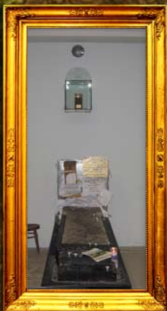
נר תמיד בציון הרה"ק מברדיטשוב