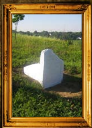
קוריץ: רבי מרדכי אב"ד קוריץ