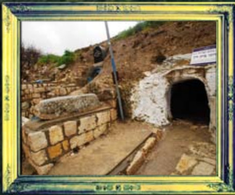
הרדוגי בית דין