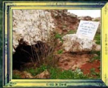
עלמא - מערת הבבלים