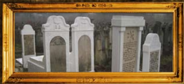
סרט - רומניה: שיפוץ חלקת הרבנים