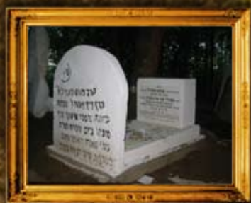
לינסק - פולין: אחרי השיפוץ