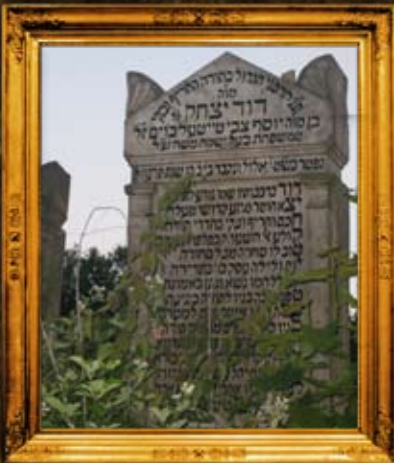
ארדובניה - הונגריה: איתור מ"ק הרה"ק רד"י ט"ב ותיקון מצבות