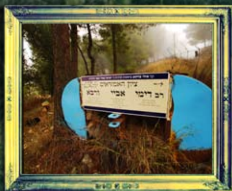
אבנית - אביי ורבא