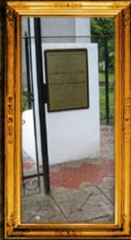
טיסמניץ: ר' יעקב קאפיל חסיד - מצבה