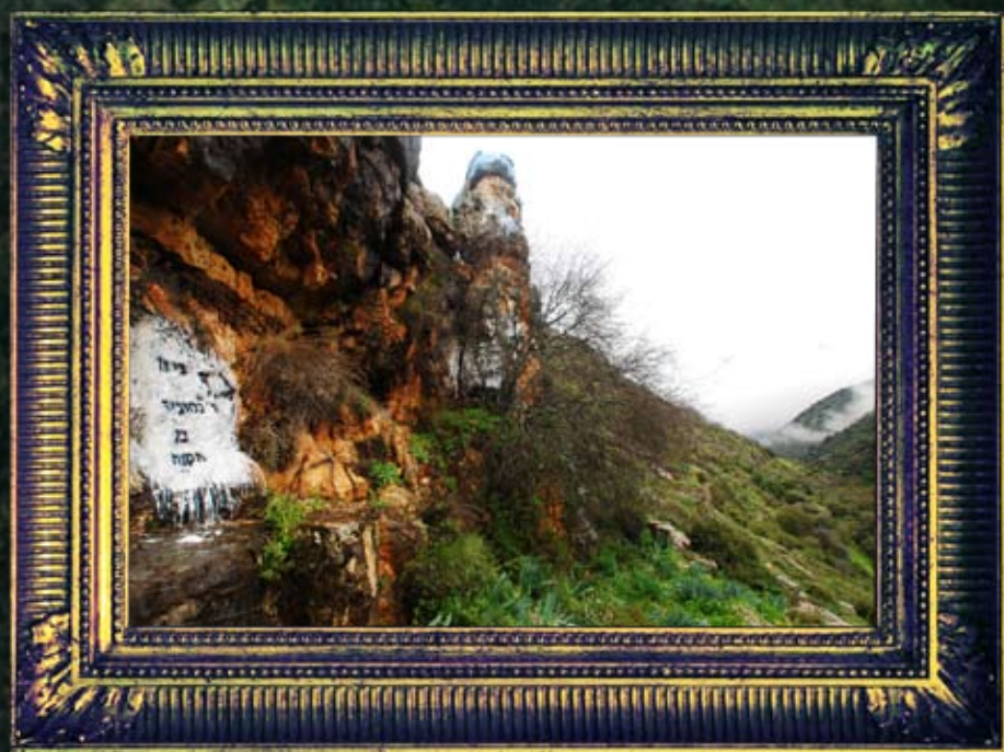
וואדי-עמוד - רבי נחוניא בן הקנה