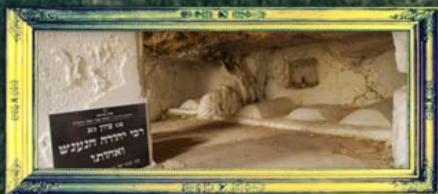
רבי יהודה הנענש