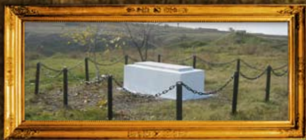
טרובניץ: המגיד מטרוביץ