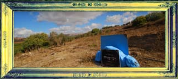
עלמא - רבי עזריח