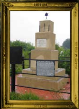
יאנוב: קבר אחים לקדושי יאנוב