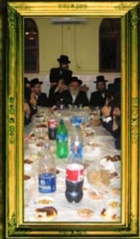
ב"ק אדמו"ר ממונקאטש שליט"א