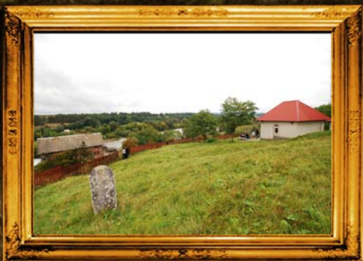
ברסלב - אוהל רבי נתן וחלק משטח בית הקברות. למטה: גדר בית הקברות