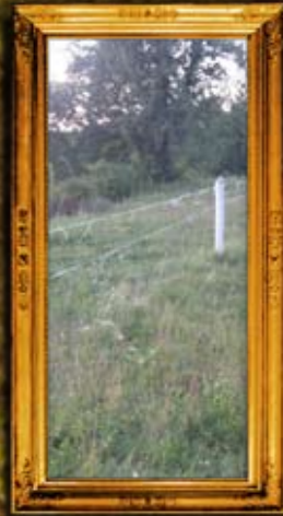
וורחיבקה: תחילת גידור ביה"ח