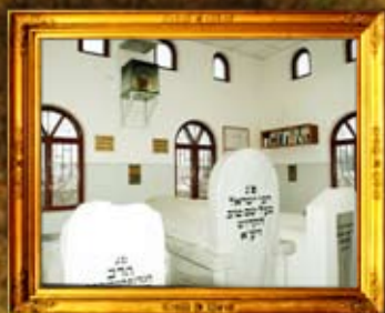
נר תמיד באוהל מרגא הבעש"ט במו' בוז'