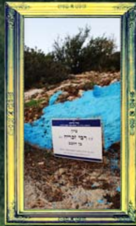
כפר ענן - רבי זמריה בן הקצב