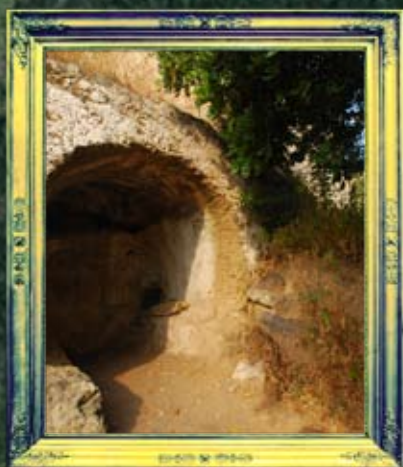
טבריה - יוחנן בן נורי