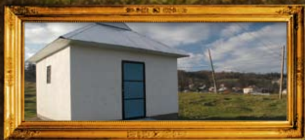
דולינו: אוהל הרה"ק רבי משה מדולינא תלמיד הבעש"ט