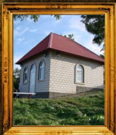
ברסלב: אוהל ציון רבי נתן מברסלב