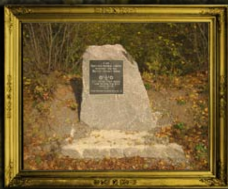
אומן: שלטי המוזה לקבר אחים