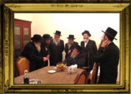
בעלז: עם ס"ק אדמור מבעלז בהדרו בבית הכנסת אורחים בבעלזא