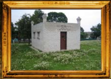
איבניץ, אוהל הרח"ק בעל 'אור המאיר'