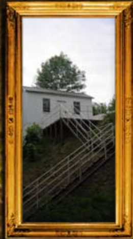
פאברייטש: הרה"ק ר' שלום שכנא מפראביטש