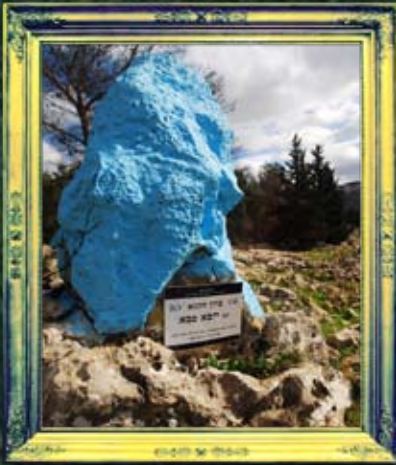
יער הבעש"ט - ר' ייבא סבא