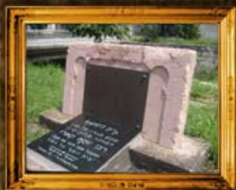
ניקופול בולגריה: בית הבית יוסף