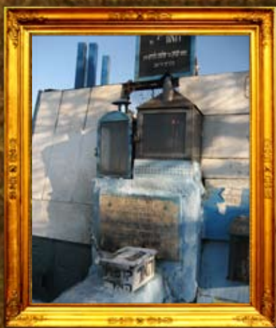
גליל: נר תמיד על ציון האר"י