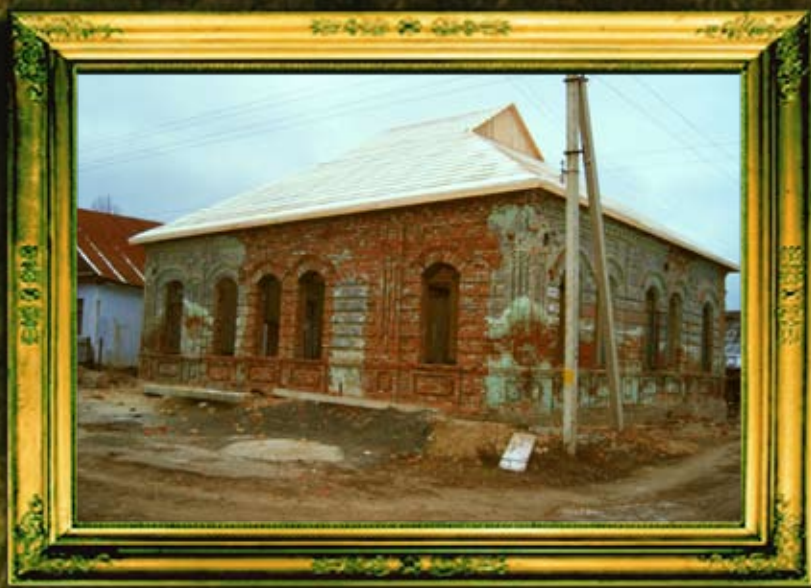
שיחזור 'דעם רבי'נס קלייזל' - ביהמ"ד של הרה"ק ה'אוהב ישראל' מאפטא