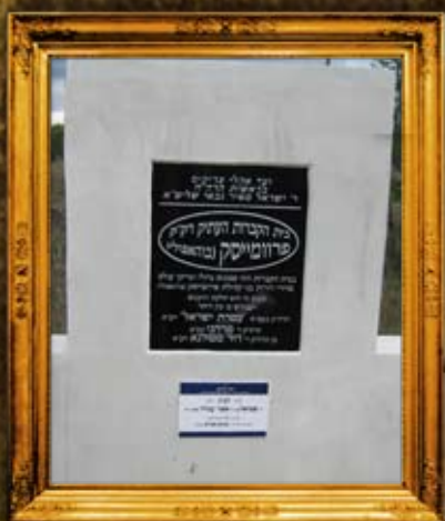
פרבמיסק-באהאפאלי: ציון בית החיים וציוני הצדיקים זע"א