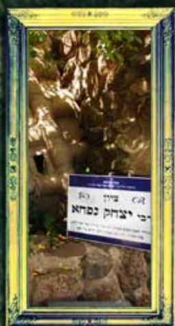
טבריה - רבי יצחק נפחא