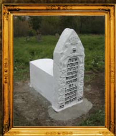
קופייגורוד: ציון הצדקת מלכה