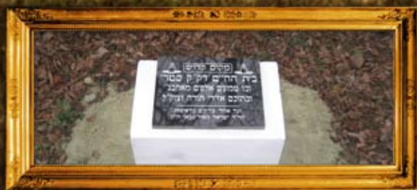
סטרי: ציון בית החיים החדש בסטרי