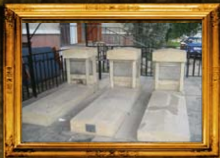
הוסיאטין: שיפוץ קברי צדיקים