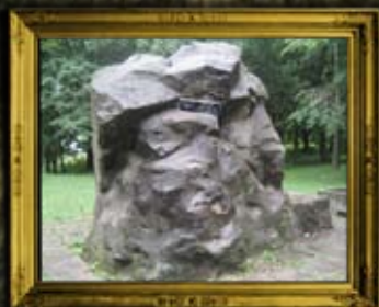
קוסוב: קבר אחים