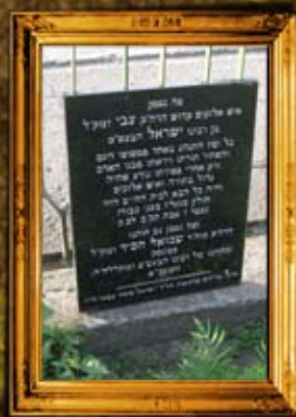
פינסק - בלרוס: הרה"ק רבי צבי בן מרנא הבעש"ט הק"