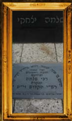
טרויש - צרפת: מקום קבורת רש"י המדוש