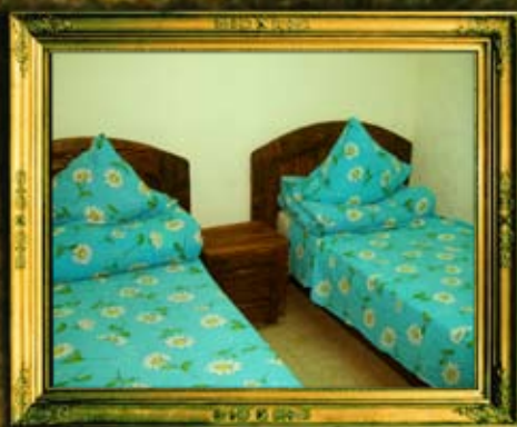
חדרי המנסת אורחים