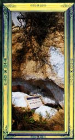
מירון - רבי יהודה בן בתירא