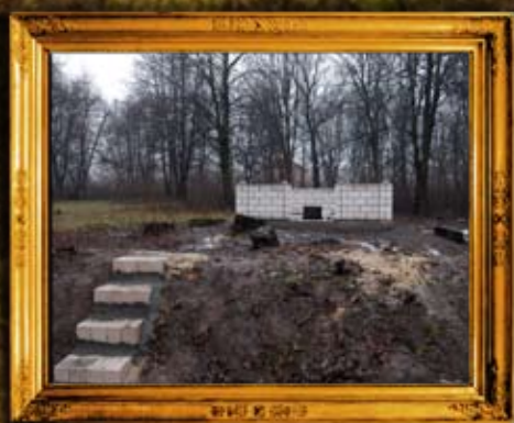
ליטוין: ציון הרה"ק ר' מנחם נחום מליטין - לאחר השיפוץ