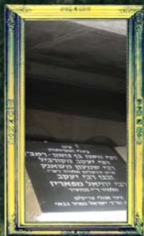
חיפה - הרמב"ן