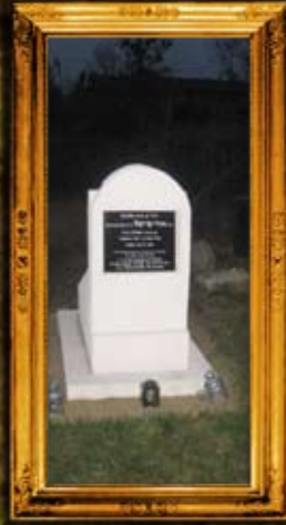
דובינקא - פולין: ציון ר' אורי פיבל מדובינקא בעל אור החכמה