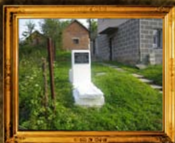
פרמישלן: הרה"ק רבי מאיר הגדול מפרמישלן