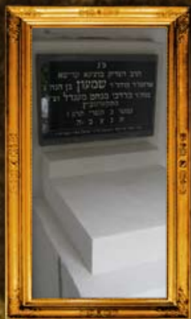
סקרנוביץ - פולין: מצבת הרה"ק מסקרנוביץ