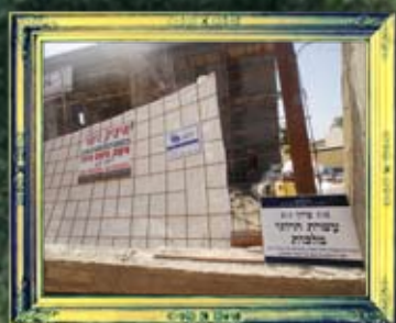
קיסריה - עשרה הרוגי מלכות