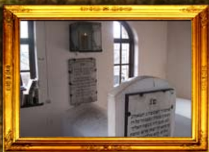
נר תמיד באוהל המגיד ממריטש והרהק רבי זושא מאניפולי