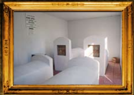
פאברייטש: פנים אוהל הרה"ק מפאברייטש