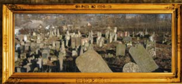
טולטשין: ניקוי בית החיים