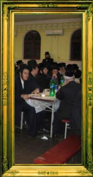
אומלים בהמנסת אורחים