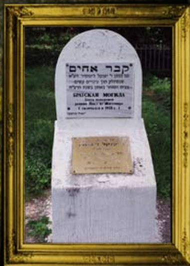
אומן: קבר אחים להרוגי הקומוניסטים בו נטמן הרה"ק רבי יעקב זיטומיר