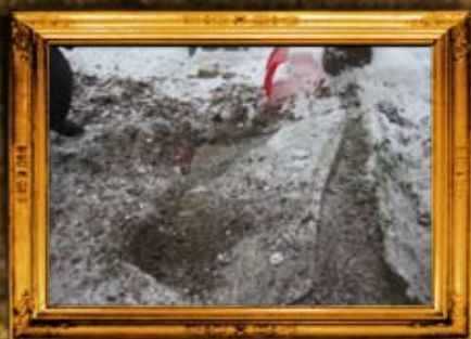
לינסק - פולין: הרה"ק רבי מנחם מנדל מלינסק אבי הרה"ק רבי נפתלי מרוזנשטיין - לפני השיפוץ