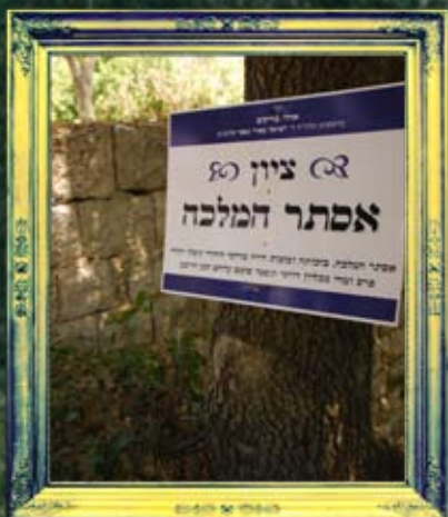
ברעם - אסתר המלכה