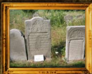
שינובא פולין: רבני שינובא