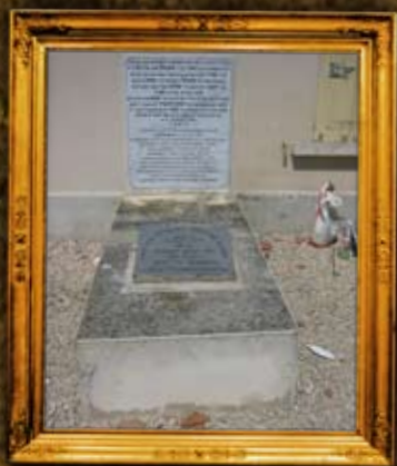
דמורפט - צרפת: רבינו תם, ר"י הזקן, רשכס ועוד