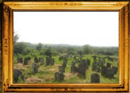
וורחיבקה: גיקוי בית החיים