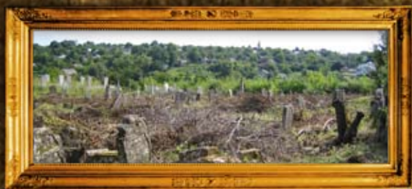
גורדוק: ניקוי בית החיים