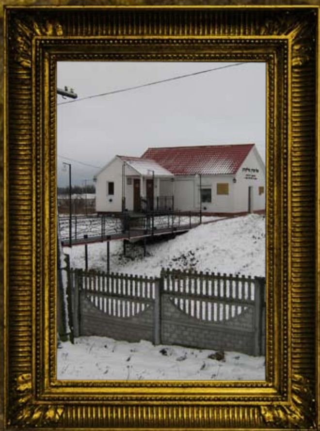
וולדניק: אוהל הרה"ק מוולדניק, הכנסת אורחים, ביתן כהנים ודרך הכהנים, גדר ביה"ק וחדרי נוחיות