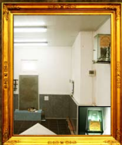
נר תמיד באוהל אדמו"ר האמצעי בניעז'ין