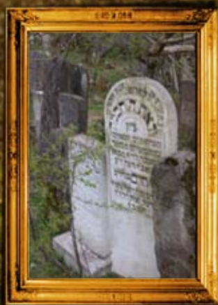
קיטוב: שיפוץ חלקת רבני קיטוב