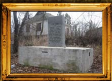
שפיקוב: הרהק רבי מודכי משפיקוב ועוד - נכד הרהק מרוזין