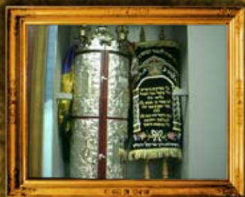
מזבח: ספרי התורה שהכניסה האגודה לבית הכנסת שבבית הכנסת אורחים במזבח