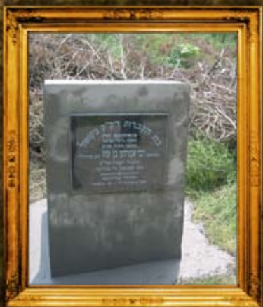
ניקופול בולגריה: סימון בית החיים