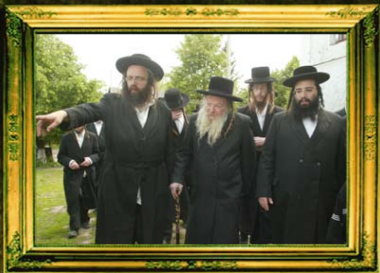
כ"ק אדמו"ר מלעלוב זצ"ל