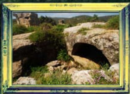
מירון - מערת מוהנים