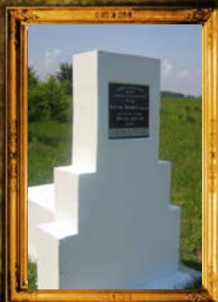
דשיב: ציון בית החיים הישן בדאשיב בו נטמן הרה"ק רבי שמואל אייזיק תלמיד הרה"ק מברסלב