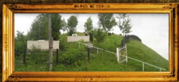
קורדיץ: הכניסה לבית החיים