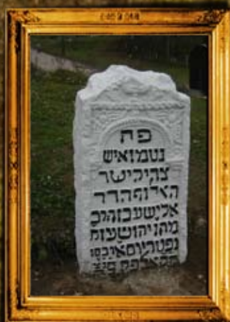
רוהטין: שיפוף מצבות בביה"ח