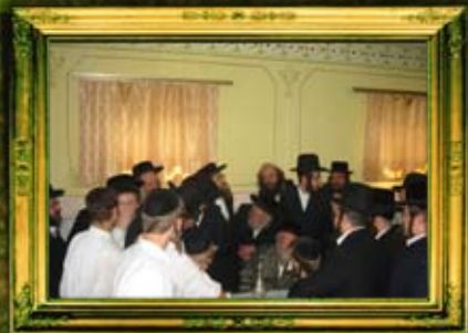
ב"ק אדמו"ר מתולדות אהרן שליט"א