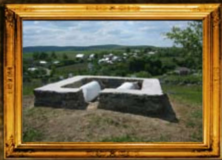
סטנוב: אוהל נכדי הרה"ק רבי מויכל מזלוטשוב