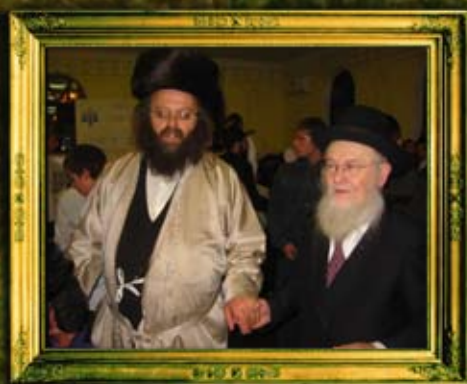
רבה הראשי של אוקראינה הרב חייקין שליט"א