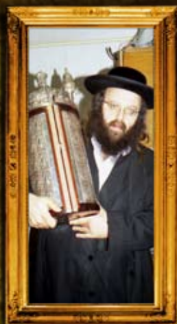
המנסת ספר תורה ספרדי לצייון מוהר"ן מברסלב באומן