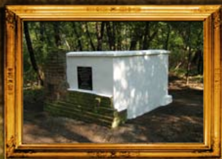
קרימנטשוק: שיפוזי אהל צדיקים וסימון בית החיים