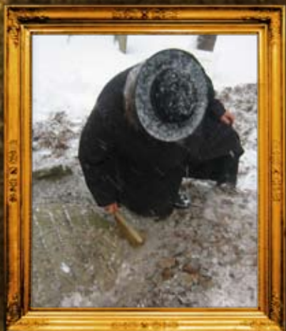
לינסק - פולין: גילוי המצבה