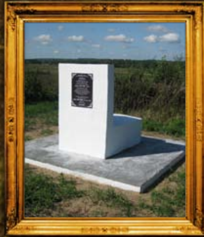
קאפוסט: ציון אדמו"ר מהרי"ל מקאפוסט ובנו