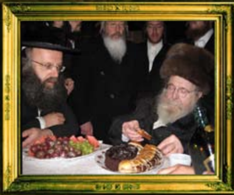
ב"ק אדמו"ר מסדיגורא שליט"א