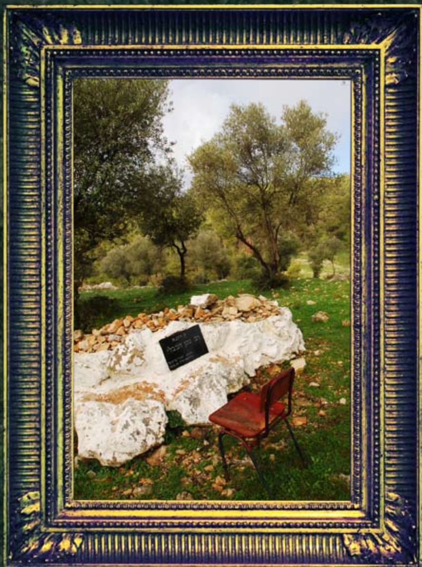
מביש צפת מירון - רבי נתן הבבלי