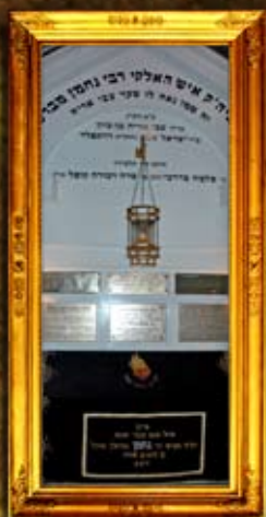
נר תמיד על ציון הרה"ק מזהר"ן מברסלב