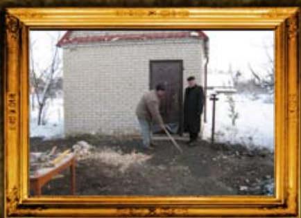
רחמסטרבקה: שיפוף אוהל הר"ק רבי יוהנן מרחמסטרבקה