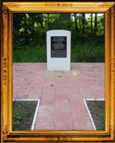
קאלאמיי: ציון הרה"ק רבי הלל מקאלאמיי וסימון בית החיים