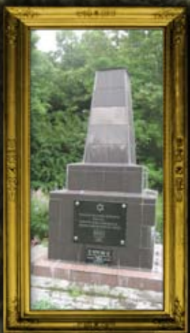
באר: קבר אחים להרוגי השואה