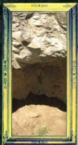
עין זיתים - עילאי