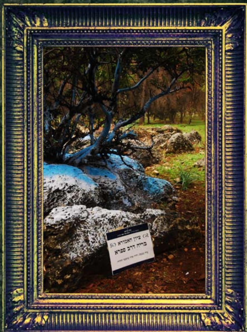
צפת - בריה דרב ספרא