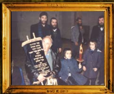
הכנסת ספר תורה אשמוני לצייון מוהר"ן מברסלב באומן