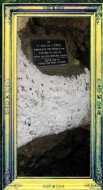
רומנה - בנימין בן יעקב