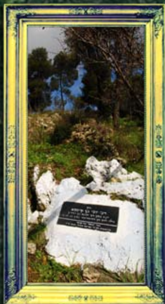
מירון - רבי יוסי בן קיסמא