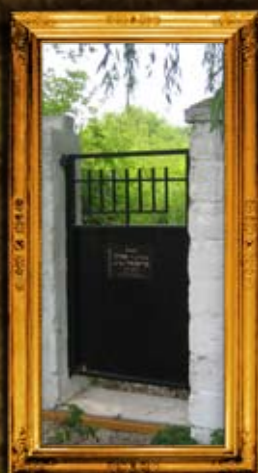
ז'יטומיר: דרך חדשה לאוהל