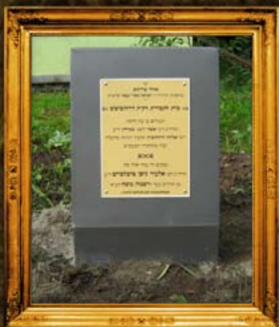
דרובניץ: ציון וסימון בית החיים ובו טמונים צדיקים זע"א