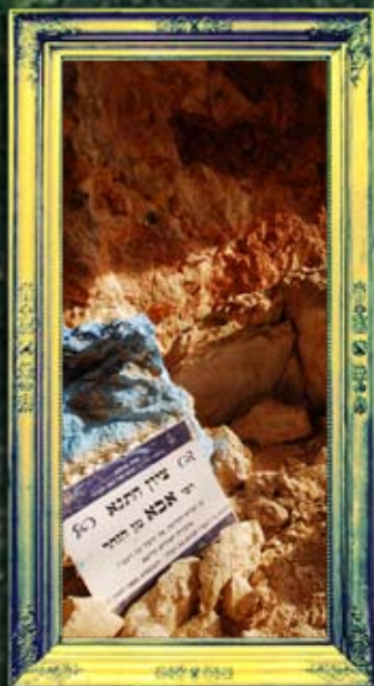
ואדי-עמוד - רבי אבא