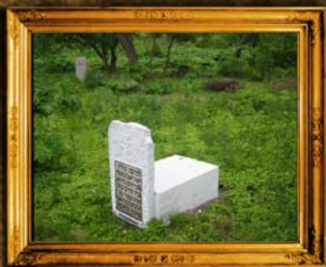
ברדיטשוב: מצבת ציון הרהק רבי ישראל נמד בעל "מעין החממה"