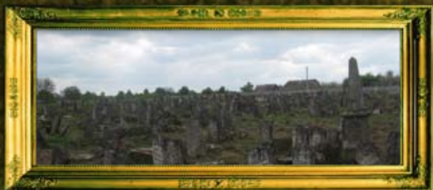
בית הקברות החדש אחרי ניקיון