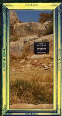
ארבל - חזקיה ראש הגולה