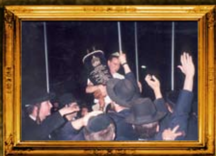
הכנסת ספר תורה לקבר שמואל הנביא