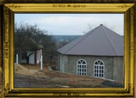
האדיטש: הכנסת אורחים בשיתוף הרב מרדכי הלפרין והרב מנדל דייטש