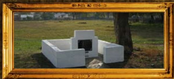
צ'רקס: ציון בית החיים וציון רבי יעקב ישראל מטשערקאס