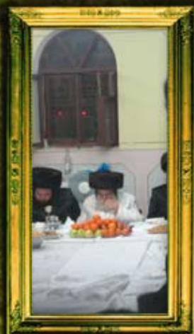
כ"ק אדמו"ר מתולדות אברהם יצחק