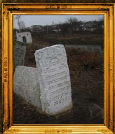
צ'צ'לניק: הרבנית מסוודין