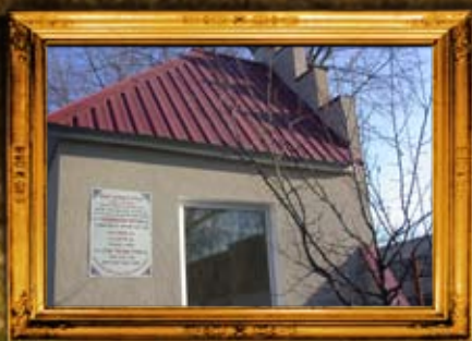
שדה לבן: תלמידיו הבעש"ט ועוד צדיקים