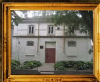
סליסטרה - בולגריה: בית המנסת העתיק של סליסטרה