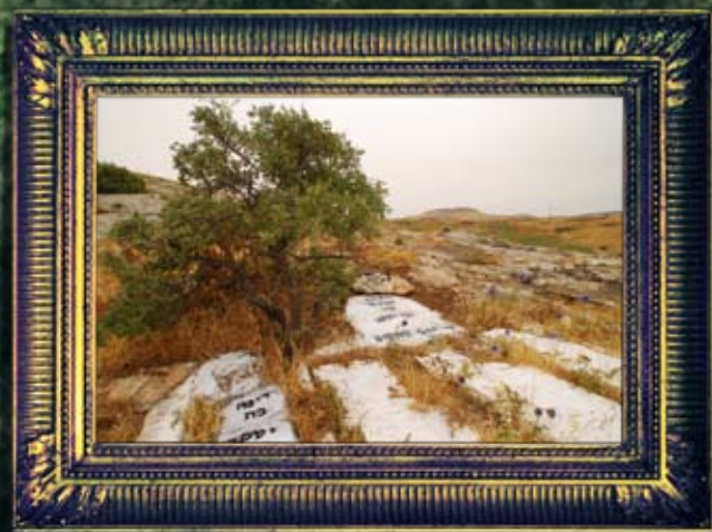
ארבל - ראובן, שמעון, לוי ודינה