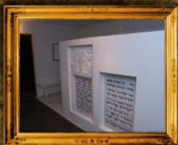
ז'לקוב: פנים האוהל והמציבות