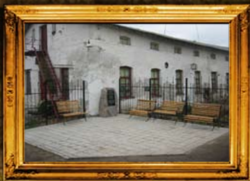
אומן, מקום הסתלקות הרה"ק רבי נחמן מברסלב