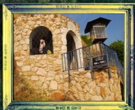
טבריה - רב אמי ורב אסי