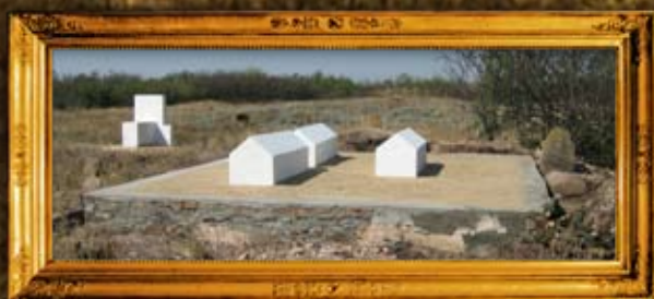
פרבמיסק: שיפוץ קברי צדיקים וציון בית קברות