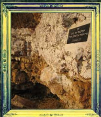
צפת - אנטיגנוס איש סוכו