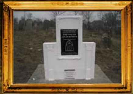
טלוסט: 'אמא שול מלכות' - ציון אם הבעש"ט