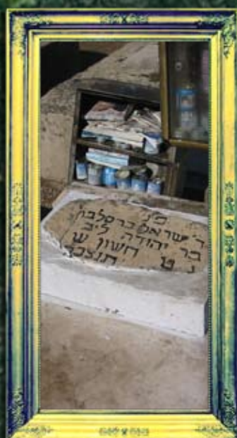
טבריה - ר' ישראל קרדונר