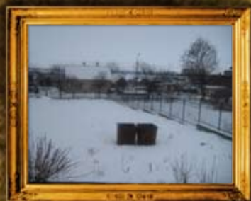
בעלז: גדר בית הכנסת הישן