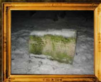
לובלין - פולין: ציון המהרש"ל - לפני השיפוץ