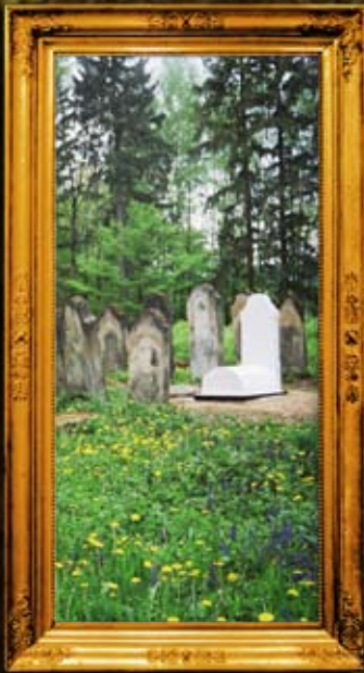
במילוב: בית החיים