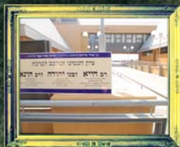
טבריה - רב חייא ורבנן