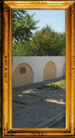
בעלו: גדר בית קברות הישן