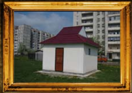
קאלוש: ר יצחק קאליש