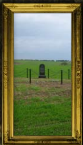
ציבליבקה: שישה קברי אחים לקדושי השואה