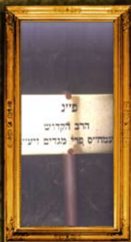
פרנקפורט דאודר (סולוביצא) - פולין: איתור מקום קברו של הפרי מגדים