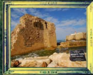
עכו - אלעזר השמונאי