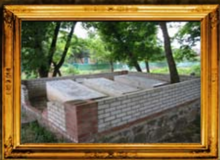
ליניץ: אוהל צדיקים