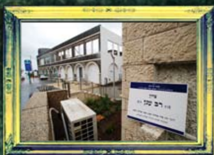
טבריה - רב ענן