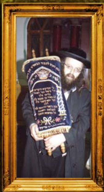
אחד מספרי התורה שהוכנסו למו"ב