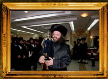
סיום כתיבת ספר תורה למו"ב מו"ב שזכור תשס"ו