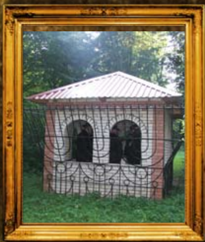
אוסטראה: אוהל ציון המהרש"א