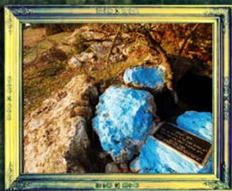
כפר ענן - ר' יעקב