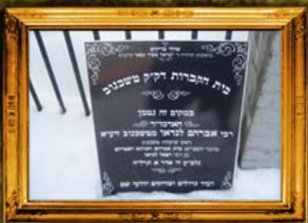
טשיכנוב: גידוד וסימון בית החיים