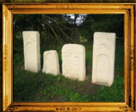
פולנאה חדש: חלקת רבנים בבית החיים בפולנאה חדש