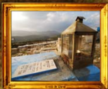
גליל: נר תמיד על ציון רבי שמועון תלמיד מוהר"ן מברסלב