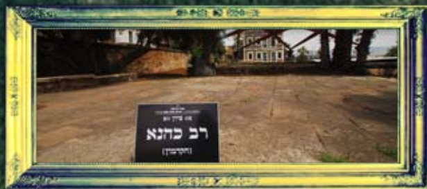
טבריה - רב כהנא