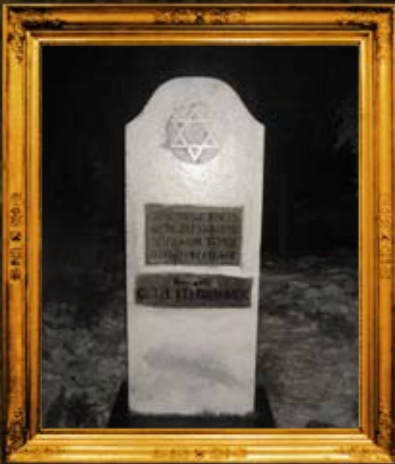
וואמה - הונגריה