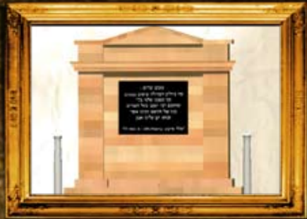
סיאוס, יוון: הדמיית מצבת סימון בית החיים בו טמון בעל הטורים