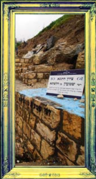
צפת - ר' שמעון בן הלפתא