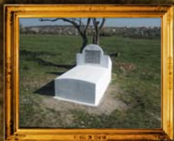
תלמידי רבי נחמן מברסלב ורבי אברהם בן רבי נחמן חזן