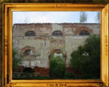
סטרי: בית המנסה של בעל הקצות - לפני הניקוי