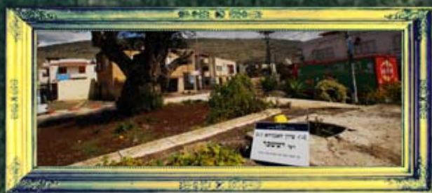
מנדה - רבי ישיכר דכפר מנדה