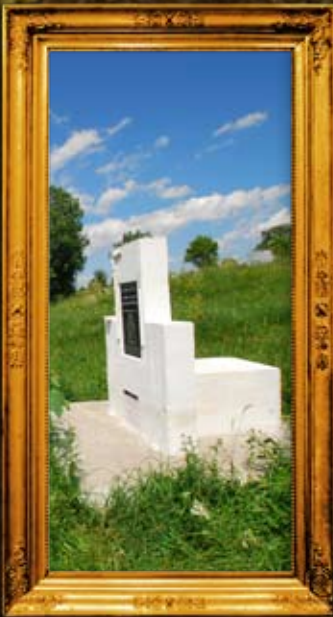
טלוסט: 'אמא שול מלכות' - ציון אם הבעש"ט