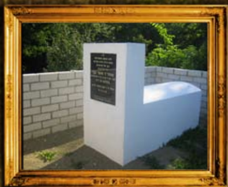
קוריץ: ציון הרה"ק בעל 'מעייין החכמה'