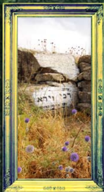
ארבל - ר' זורא