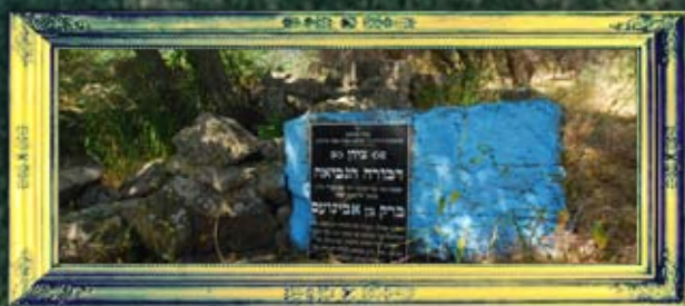
קדש נפתלי - דבורה הנביאה וברק בן אבינועם