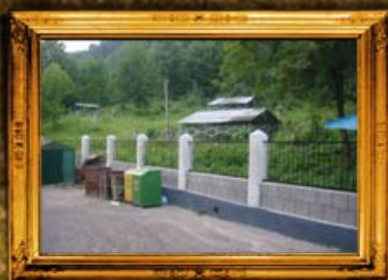
קוסוב: אדמו"רי בית קוסוב ויז'ניץ' וגידור בית החיים