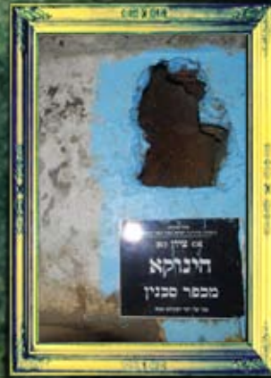
צפת - הינוקא