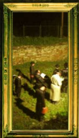
יסודות בית המנסת הבה