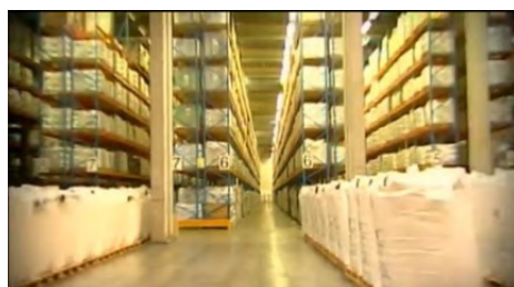
מפעל "גדות" תעשיות ביו-כימיות במפרץ חיפה על מקומו של מפעל "מיילס" שפשט את הרגל

בסופו של דבר, אכן נסגר המפעל, בעקבות חסימת השוק המקומי בפניו, וכל ההשקעה שהושקעה בו ירדה לטמיון. במשך הזמן נמכר המפעל לגורמים אחרים, והוא פועל עד היום תחת השם 'גדות', תעשיות ביו-כימיות, ליצירת חומרי גלם שונים, לאו דווקא גלוקוזה ומלח לימון.