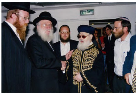
מרן הגר"ע יוסף זצ"ל עם הגרל"י הלפרין זצ"ל בביקור במכון. משמאל נראה בנו הגר"ר שמואל אלעזר שליט"א