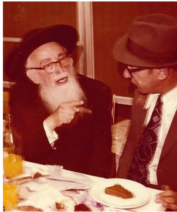
פרופ' זאב לב ז"ל בשיחה ערנית עם מרן הגרש"ז אויערבאך זצ"ל, במהלך שמחת הבר-מצוה של ראש המכון הגרא"מ הלפרין שליט"א

מקצועית, לבדוק תחילה את נימוקי הבקשה ונסיבותיה אם יש בהן ממש, ובמקרה הצורך לחפש ולמצוא דרכים ופתרונות טכנולוגיים מתאימים שיאפשרו את השבתת המפעל ולהביאם לדיון בוועדה.