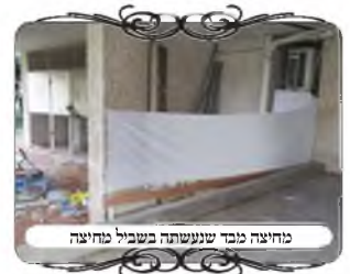
מחיצה מבד שנעשתה בשביל מחיצה

כשהגיע הבדוק של מוקד העירוב, העיר שהמצב הזה שנוי במחלוקת הפוסקים, מהו שיעור הנדנוד הפוסל את המחיצה. החזו"א כותב שהנדנוד פוסל רק באופן שהרוח מביאה למצב שהמחיצה נפסלת, כגון שמתרוממת מהקרקע ג' טפחים, או יורדת מגובה י'. אבל אם נשארת בגובה ורק זהה אנה אנה, הרי היא כשרה. אבל בדברי המג"א והמשנ"ב (סי' שסב, ... שסג, כ. תרלח, מז) מבואר שעצם הנדנוד פוסל גם כשהמחיצה אינה נופלת או נפסלת, וכמבואר בספר הפוסקים. אלא שלא מבואר בפוסקים מהו שיעור הנדנוד לשיטה