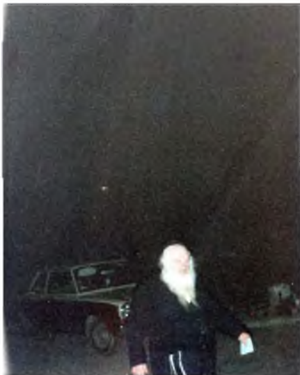
כל הזכויות שמורות

היה בזה קצת מן התימה: הלא את הדואר מרוקנים בשעות הצהרים, ולמה לו למחר לשלם בשעת הערב? שיחכה עד לאחר ותיקין וכשהוא יורד לבית הכנסת ילך לנקודת הדואר, ועל מה המהירות? אלא שרצה לקיים את המצוה בזריזות ולא להתעכב רגע "אין משהין את המצוות, שאם באה מצוה לידיך אל תחמיצנה אלא עשה אותה מיד (מכילתא).