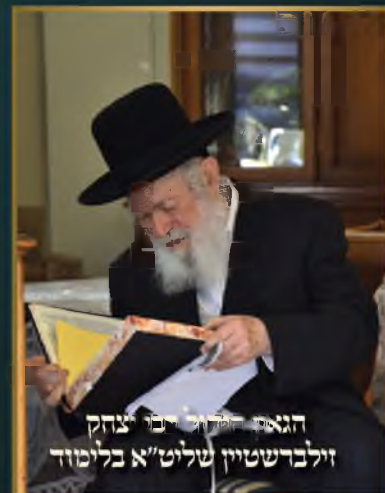
הגאון הגדול רבי יצחק זילברשטיין שליט"א בלימוד

יו"ל ע"י מערכת קובץ גליונות. נשמח לקבל מדי שבוע תמונות למדור חדש זה. נא להזהר מזכויות יוצרים וחשש גזל. תמונות יש להעביר למייל המערכת: k.gilyonot@gmail.com