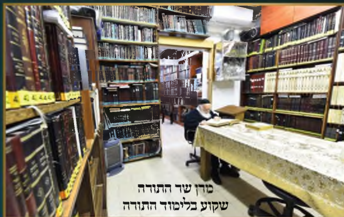
מזן שר התורה שקוע בלימוד התורה

"אחר פטירתו של הסטייפלר זצ"ל הניחו את הספורדיק בשקית, וכשפתחוה לאחר כשנתיים, ראו כי הוא התפורר ואיננו. כיום חובש גם אבא שטריימל במועדים - בקידוש ובברכת המזון. הוא אבא החל בכך כאשר קיבל סבא הרב אלישיב שטריימל חדש ומסר לו את הישן לאבא."