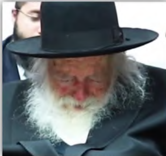
מרן הגר"ח בוכה

היה זה ביום ג' לפרשת בשלח תשע"ט, אחר הצהריים, כאשר זכיתי להיכנס עם שניים מידידי אל הקודש פנימה, אל קודש הקדשים של דורנו, ביתו נאוה קודש של רבינו. והנה, כאשר עמדנו לפניו, בעוד מרן שליט"א יושב והוגה בתלמודו, ראינו שהוא מצביע עם הסימנייה על שורות-הגמרא שעסק בה באותה עת, ולפתע פרץ בבכי נורא, והתייפח כך כ-10 שניות! ויהי לחרדת אלקים!