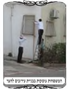
המשפחות עוסקות בבניית עירובים לחצר

במוקד העירוב משקיעים כעת זמן רב להתאמץ לענות לשואלים, יחד עם הצורך הפרטי המיוחד כעת לכל אחד. וכן מנסים להגיע למקומות המבוקשים עד כמה שאפשר בתנאים הקיימים, לבדוק את החצרות, להסביר כיצד לעשות, מה כשר ומה