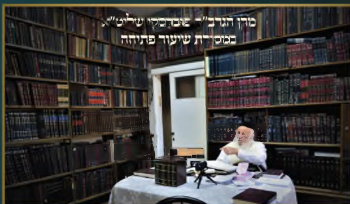
מזן הגר"ח - שבתסקי שליט"א במסירת שיעור פתחה