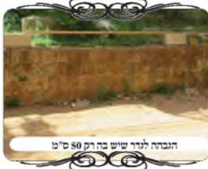
הגבהה לגובה שיש בה רק 80 ס"מ

בדרך אגב יש לציין עוד עצה לפתרונות פרקטיים, במסגרת הסיוע למבקשים לעשות מחיצות, ויוצאים לחפש חפצים לבנות אילתורים לגדרות, ואין קעת קרשים ברחובות, מפני שאין שיפוצים ביתיים. ניתן להשתמש בקרשי הסוכה, שהדפנות ישמשו למחיצות, אלא שאם מעמידים אותם צריך הרבה קרשים ודפנות, לכן ניתן להשכיב אותם, אלא שאם משכיבים את הדופן, וגובה המחיצה היא רוחב הקרש, הרי הוא רק 80 ס"מ בדרך כלל, ואין בו שיעור מחיצה לשיעור חזו"א, כפי שהתקבל להחמיר. והפתרון הוא באחד משני האופנים, א' להגביה את הקרש בעזרת בלוקים וכדומה,