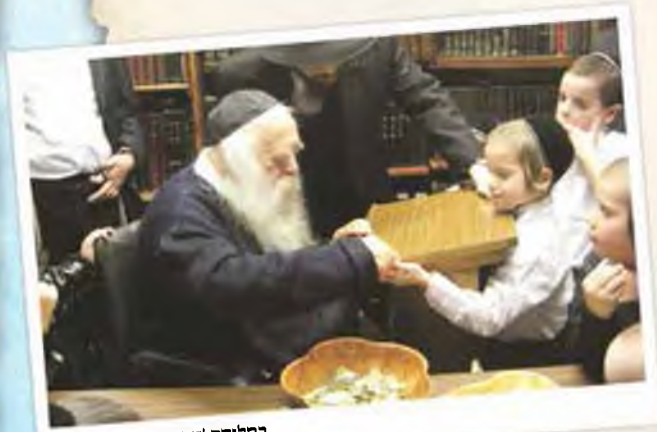
בחלוקת 'דמי חנוכה' לצאצאים

אמא, לעומת זאת, הייתה מחלקת דמי חנוכה בשפע רב. עוד קודם לכן הכינה רשימה של שמות הילדים והנכדים, רשמה סכום נכבד בעבור כל אחד ואחת, ונתנה את הכסף לאמהות לחלק לילדיהן."