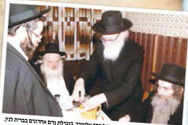
הסבא הגדול הרב אלישיב, בנטילת מים אחרונים בברית לגין.