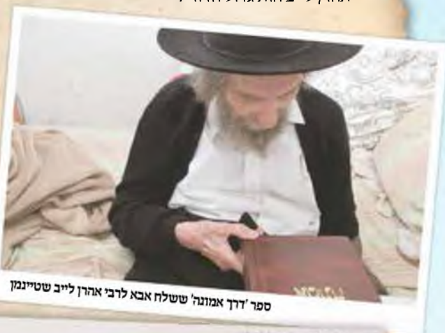
ספר 'דרך אמונה' ששלח אבא לרבי אהרן לייב שטיינמן

"בשאלות קשות היתה אמא נועצת באבא, ומהוראותיו לא זזה ימין ושמאל. כשאבא לא היה בבית והשאלות היו דחופות, היתה מפנה את השאלות אל רבי אהרן לייב שטיינמן, כדברי אבא, שרבי אהרן לייב הוא גדול הדור".