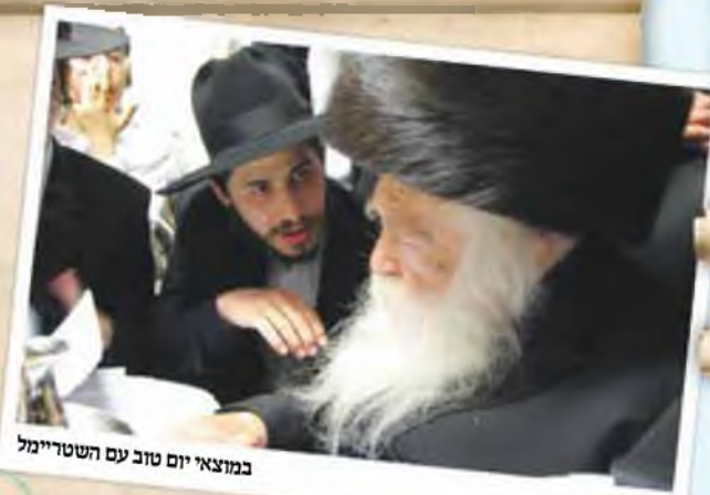
במוצאי יום טוב עם השטריימל