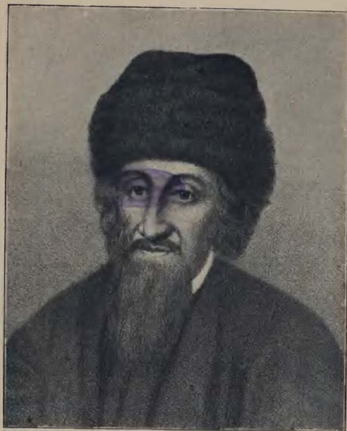
הגאון ר' צבי אישכנזי "חכם צבי".