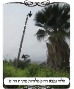
הלחי נמצא רחוק מלהיות תחת החוט

בשבוע זה הוקם עירוב נוסף בישוב הסמוך לטבריה, שהרבה קבוצות נוסעים אליו, אך לצערינו העירוב של המקום פסול לגמרי, וכבר פנינו