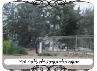
התקנת הלחי בקרקע ולא על קיר נמוך

מתוך זה התעוררנו לדון בשאלה, באופן שהיו מעמידים את הלחי במקום שהקיר נמוך רק שני טפחים, ואז אפשר להעמידו על הקיר, דלא גרע מלחי שיש מתחתיו חלל פחות מג' טפחים. האם יספיק להעמיד לחי של שמונה טפחים בלבד, כמו באופן שיש מתחתיו חלל, שהחלל משלים לשיעור י' טפחים כמבואר ברמ"א שם, או שמא כשיש אבנים תחתיו א"כ הקרקע גבוהה יותר, ואין שייך לומר לבד עד האדמה שלמטה לפני הקיר, ואם תאמר הרי לגבי המעקה מספיק שיהיה בו 8 טפחים, והוא מצטרף עם 2 מהקיר, אך זה דוקא למחיצה שהיא יכולה להיות ארוכה, משא"כ לגבי לחי שהחלק הארוך אינו מצטרף, א"כ הקיר אינו מצטרף, ורק מדין לבדו אנו רוצים לצרפו, ויתכן שבאופן זה אי אפשר לדון דין לבדו, ולכן צריך שיהיה בלחי י' טפחים בפני עצמו, ויש להאריך ולפלפל בזה, וע' בהגדרות החזו"א שם מדוע מתיחס לקרקע שלפני הקיר, ולא אומרים שהקיר הוא הקרקע. ותן לחכם ויחכם עוד.