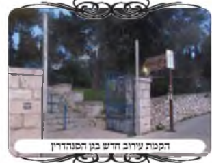
הקמת עירוב חדש בגן הסנהדרין

בשבוע זה זכינו בס"ד להקים עוד עירוב קבוע בירושלים, בגן הסנהדרין הסמוך לשכונת סנהדריה, שעד היום הוא היה פתוח לרחוב שלפניו שהעירוב שבו עם חשש רה"ר כמו בשאר רחובות הפתוחים בעיר, וכעת שעשינו צורות הפתח בכניסות הגדולות והקטנות, יהיה אפשר לטלטל בו לכתחילה.