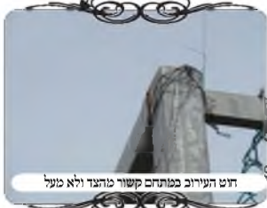
חוט העירוב בפתח קשור מודגד ולא מעל

לגבול, כיון שאינם רגילים לשהות במקום שהעירוב מצומצם סביב לחדרים. יש לציין שמנהלי האירוח שיתפו פעולה יפה עם עבודות העירוב, ואמרו שכבר כמה פעמים עשו להם כזה עירוב למחמירים, אלא שכאמור הוא נצרך גם למקילים.