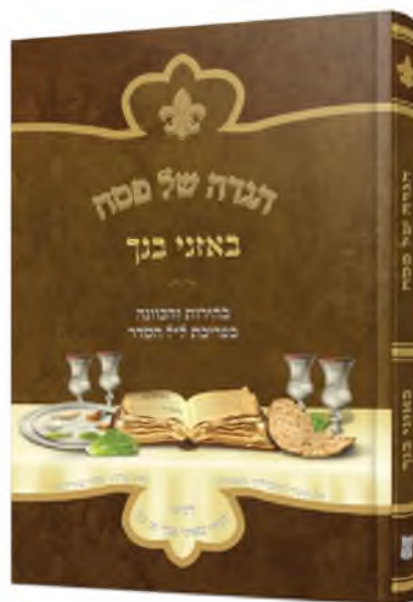
מבית "בני בני" להערות והארות, ולהשגת העלון, ניתן לפנות במייל: z6161523@gmail.com

ויש נותנים בשלב זה לקטנים לשנות כוס שני ומיד נוטלים ידים ומחלקים להם את הכזיתים של מצה מרור וכורך, ומברכים ברה"מ"ז עם כוס שלישי. ואז הם כבר רגועים לגמרי ולא מפריעים לשאר המסובים. ויש כאלה שנותנים לקטנים כרפס בשפע שלא יהיו רעבים, וגם כך יהיו רגועים עד מוציא מצה. (וע"ע בהגדה ובחברת שיעורי הכנה לליל הסדר שלל עצות ורעיונות כיצד לנהל נכון את כל הפרטים הרבים הנצרכים לליל הסדר).