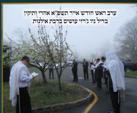
ערב ראש חודש אייר תשפ"א אחרי ותיקין בדיל ניו ג'רזי עושים ברכת אילנות