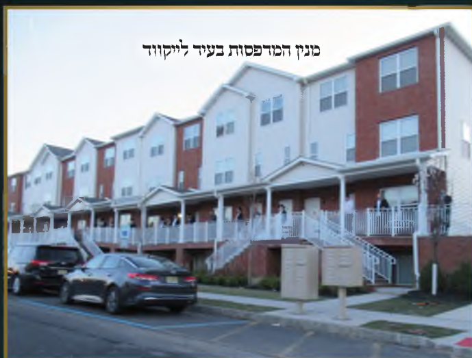
מנחם המדפסות בעיר לייקווד