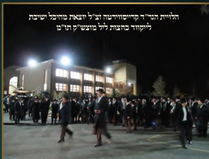
הלוויית הגד"ק קדישזוידטה זצ"ל יוצאת מהיכל ישיבת לייקווד כחצות ליל מוצש"ק תו"מ