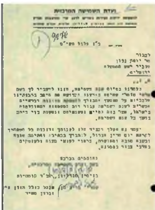
אחד המכתבים הנדירים עליו חתומים ר"ב מנדלזון ור"ש גרינמן

אל מערכת 'דברי שלח' הגיעו ציור מסמכים נדיר, היישר מארכיון 'משרד הדתות', (באמצעות ידידנו הנעלה הר"ש הלוי שיחיה), שעדיין לא פורסם, ממנו עולה התכתבות ענפה בין רבי בנימין מנדלזון ורבי שמריהו גרינמן, לבין שר האוצר וראשי הממשל דאז.