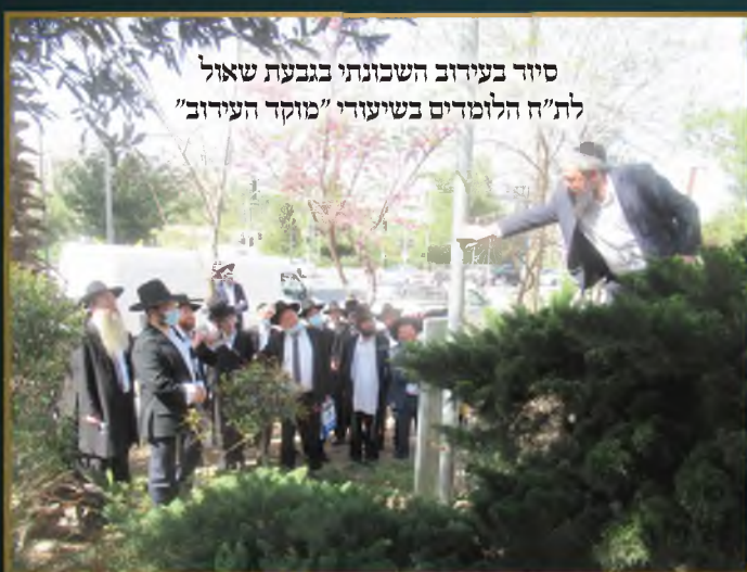
סיוור בעירוב השכונתי בגבעת שאול לת"ח הלומדים בשיעורי "מוקד העירוב"