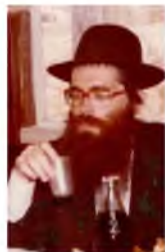
תמונה נדירה של הגר"ש שטינמן שליט"א בצעירותו