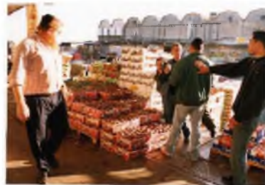
שוק סיטונאי של ירקות בירושלים

במקרים רבים המשווקים אינם "הגונים" בלשון המעטה, והם קונים סחורה שנעבדה באיסור, ומצהירים כי זה מחוץ לארץ או גדל אצל גוי.