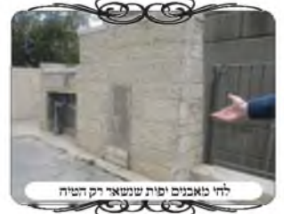
לחי מאבנים יפות שנשאר רק הטיח