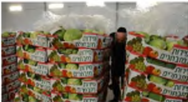
משגיח כשרות בודק יבול של חסה