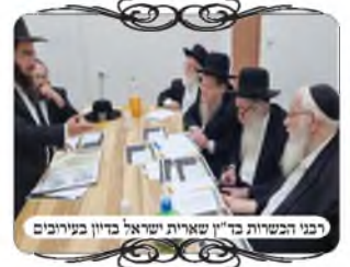
רבני הכשרות בד"ץ שארית ישראל בדיון בעירובים

ציפוי קירות, מאבנים ירושלמיות קטנות. עבר זמן ואחד מהתושבים החליט להתנכל לעירוב, ושבר את האבנים שהודבקו, והשאיר רק שלושה מהם. האחראי הצטער מאוד, גם על העבודה שהשקיע, ויותר על העירוב שנהרס, ולפתע עלה לו רעיון להכשיר את העירוב במצב הזה, כיון שלאחר שהמתנכל הסיר את האבנים נשאר הטיח, שאמנם הוא לא נראה יפה, אבל זה הוא לא ראה