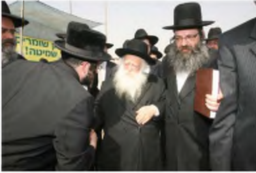
רבינו שליט"א עם בנו הגרא"ש, בבואם לחזק חקלאים שומרי שמיטה

כהמשך לסדרת המאמרים על ההכנות לשנת השבע, נספר כאן שבשנת השמיטה הקודמת, שנת תשע"ה, אירע חידוש מעניין.