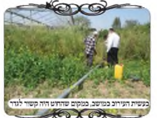
בעשית העירוב במושב, במקום שהודח היה קשור לגדר