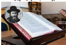
דמות דיוקנו של הג"ר מאיר שפירא זצ"ל מחולל הדף היומי

מקור נוסף לשמחה בגמר מצוה, כתוב ב פסוק (מלכים א פרק ג פסוק טו) וַיִּזְכֹּר שְׁלֹמֹה הַנֶּהֱחָל חֲלוֹם, וַיָּבֹא יְרוּשָׁלַם וַיַּעֲמֵד