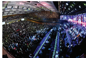
מעמד הראשון של סיום הש"ס מחזור י"ג על ידי ארגון 'דרשו' בנייני האומה מוצ"ש מקץ ל' כסלו תשע"ט

עוד אומרים בשם הגר"א מזילנא שאילו היו יודעים בני אדם מעלת סעודת הסיום, היו מלקקים את הצלחת בסעודת הסיום. ומעלת הסיום מרומז בראשי תיבות של המלאך המקטרג סמא"ל, "סיום מסכת אין לעשות".