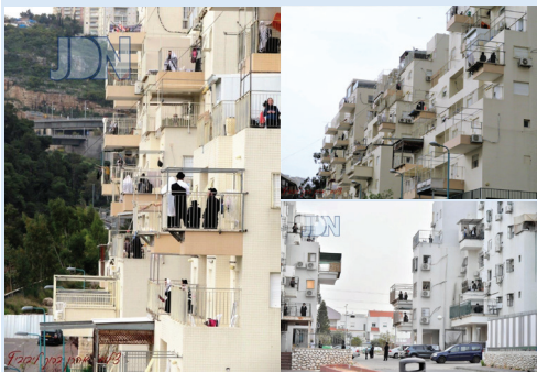
מניני המרפסות בחיפה ואשדוד...