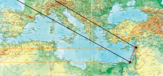
כל שכנגד ארץ ישראל הרי הוא כארץ ישראל. התמונה מתוך קונטרס מנחת אי"ש על גבולות הארץ

אמנם יש שהקשו על רעיון זה כמה וכמה קושיות