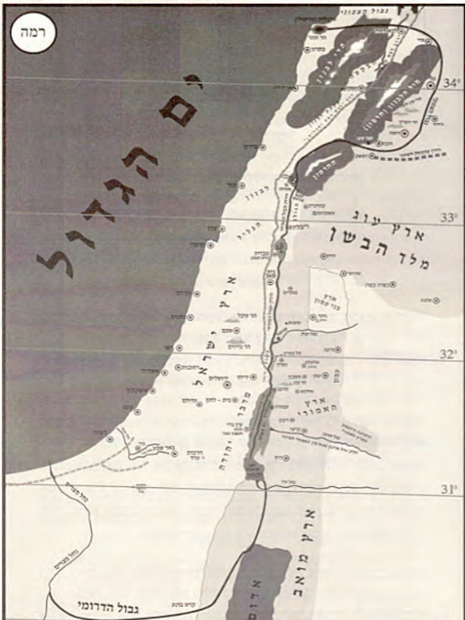
גבולות ארץ הקודש לפי ספר אלה מסעי להרה"ג ר' דן שווארץ זצ"ל

ניקח לדוגמא את אתרי הגבול הצפוני [והצפון מזרחי]. גבול ארץ ישראל מן הים הגדול ועד הכינרת עובר