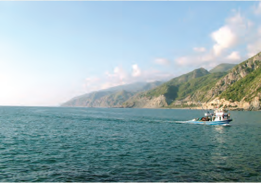
ג'בל מוסא. הר ההר לפי שיטת ספר ים ודרום ירשה

הגר"ח קנייבסקי בספרו דרך אמונה על הרמב"ם הלכות