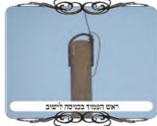
ראש העמוד בכניסה לישוב

ישוב נוסף שבדק על ידי מישורו אחר, והגיע לישוב וראה שכל הישוב מוקף בגדר. עבר ובדק ולא ראה בגדר שום בעיה, אפילו לא פירצה קטנה שצריכה היתר מדין עומד מרובה. עד שהגיע אל פתח הכניסה הראשי של הישוב, ושם היתה צורת הפתח עם שני עמודים גבוהים, הוא ראה שהחוט שעליהם הוא חוט ברזל מזוגג, שיש חוששים במראה שלו מחשש פתחי שימאזי. [כן מובא בשם מרן הקהילות יעקב], אבל זה הוא לא יכול לדרוש מעירוב של ישוב. אבל יש עוד דבר שצריך לבדוק כפי שלמדנו בשיעורים, והוא צורת קשירת החוט לראש העמוד. פעמים רבות מתברר שבנקודה זו יש שינוי שיכול לפסול את כל העירוב היפה והחזק, הוא נשא עיניו לראש העמוד, ואכן גילה להפתעתו שאלה חמורה, יש כאן שינוי מצורת העמודים המקובלת, ויתכן שהצורה פ