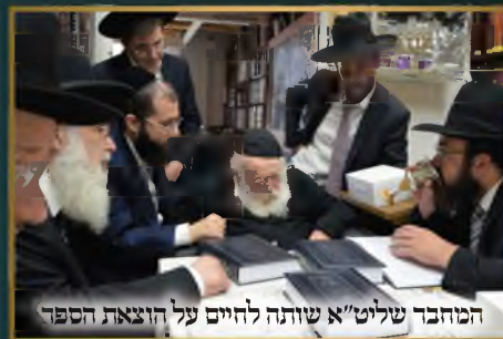
המחבר שליט"א שותף לחיים על הוצאת הספר