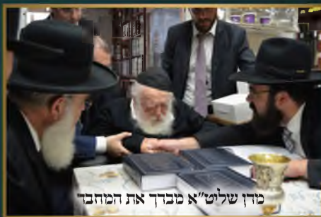
מרן שליט"א מברך את המחבר