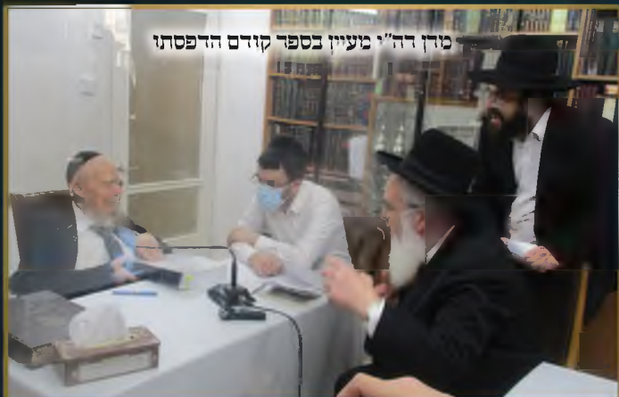
מרן דה"י מעיין בספר קודם הדפסתו

לרגל הוצאת הספרים "תשובות תל תלפיות" - 1400 תשובות על עניני עוסק במצוה