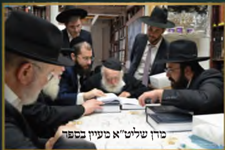
מרן שליט"א מעיין בספר