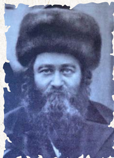
הגאון המהר"ם שפירא זצ"ל

והנה לפניכם (07-01) ניגון היום הרת עולם מפי ר' הערשל. ניגון זה היה נפוץ וידוע בעיר ליזענסק כנשמע מפי עוד זקנים מהעיר, לא ידוע מי הלחינו.