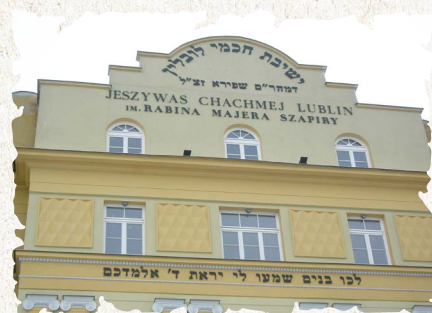
בניין הישיבה המפורסמת