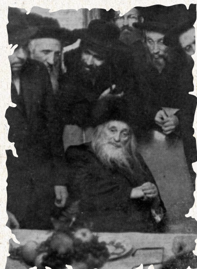
האדמו"ר מסאטמאר צוק"ל

מה היה בה, בתחינתו? נוסח מרומם, רגש נשגב וקרבת אלקים. תפילותיו הזכות היו לשם דבר. המונים נהרו מכל שכונות ירושלים לשמוע את תפילתו, עד שמרוב