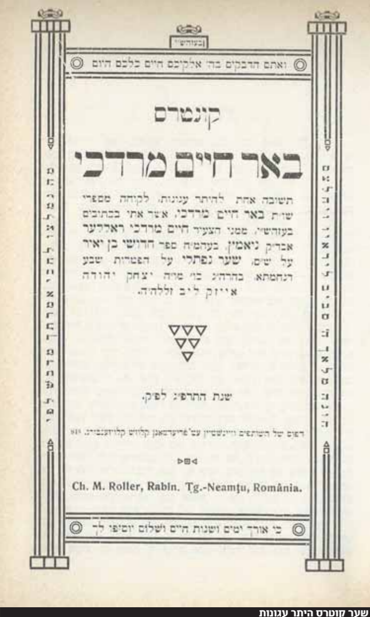
שער קונטרס היתר עגונות

זכותו יגן עליו ועל כל ישראל את שאלותיהם.