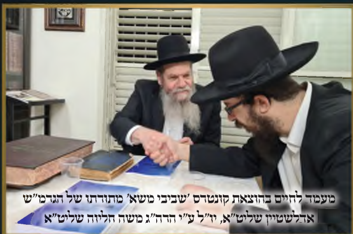
מעמד לחיים בהוצאת קונטרס 'שביבי משא' מתורתו של הגרמ"ש אדלשטיין שליט"א, יו"ל ע"י הרה"ג משה הליוה שליט"א