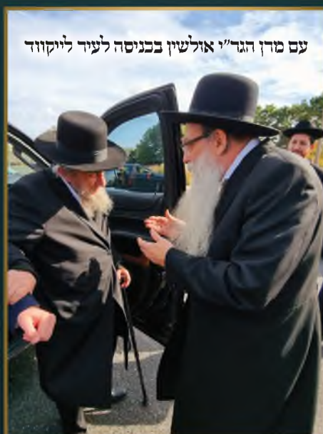
עם מרן הגר"י אולשין בכניסה לעיר לייקווד