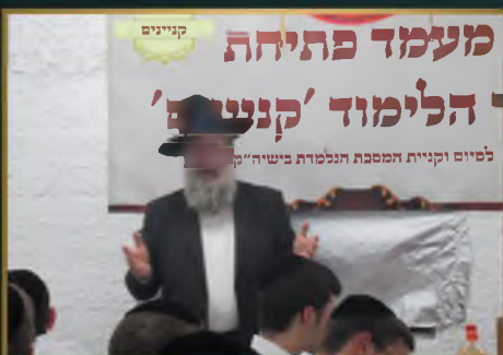
מעמד פתיחת הלימוד 'קניינים' למיום וקניית המסכת הנלמדת בישיבה