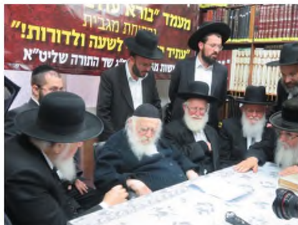
רבינו באסיפה מיוחדת בביתו לפני מספר שנים, עם חלק מרבני העיר רחובות שליט"א