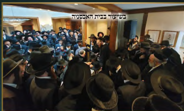
בשיעור בבית האכסניה