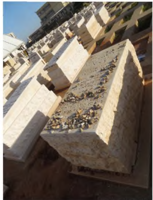
המצובה שעשויה כולה ממקשה אחת של אבן ולא כשאר מציבות