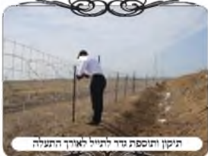
תיקון ותוספת גדר לתייל האורך התעלה

בענין זה יש להדגיש שיש שתי סיבות שההנהגה הנכונה גם בעירובים של הרבנות, שלא להסתמך על תל המתלקט בערימת עפר כזו או תעלת מים ללא קירות בטון, א. מצוי שמשתנה העפר מחמת עבודות פיתוח או נסחף מהגשמים, ואין הבדק בקי לשים לב לכך. ב. במקום שיש קטע פסול, קשה לתקן אותו כראוי, כי אם יעשה את הפתרון הרגיל על ידי צורת הפתח, יהיה לו בעיה באיזה מקום להעמיד אותם שלא יהיו על השיפוע, ויחד גם יהיה חיבור מחיצה בין העמוד למקום שבו התל כבר נחשב מחיצה. ודברים אלו לומדים מתוך הנסיון, וכפי שבארנו בשיעורי העירובין למעשה. לכן אם רוצים להדר את העירוב, דבר ראשון שלא לסמוך על התל של תעלת המים. הרב קיבל את הדברים, והורה לעשות גדר לאורך גבול העירוב.