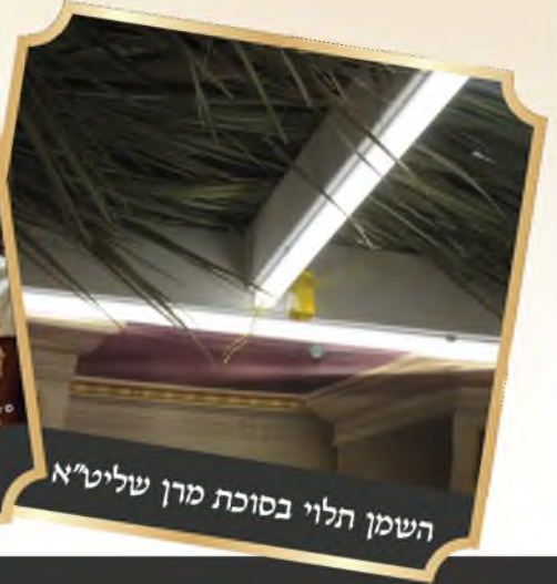
השמן תלוי בסוכת מרן שליט"א