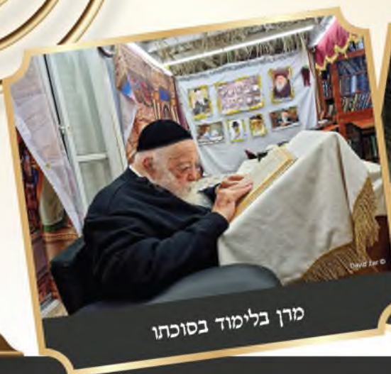
מרן בלימוד בסוכתו

"יש נוהגים לתלות שמן זית דך לנוי סוכה או להניחו בסוכה, ולייחדו בשביל להשתמש בו אחר כך למצות הדלקת נרות חנוכה, והוא מנהג יפה וסגולה שיאריך ימיו ויזכה לקיים מצות הדלקת נרות החנוכה"