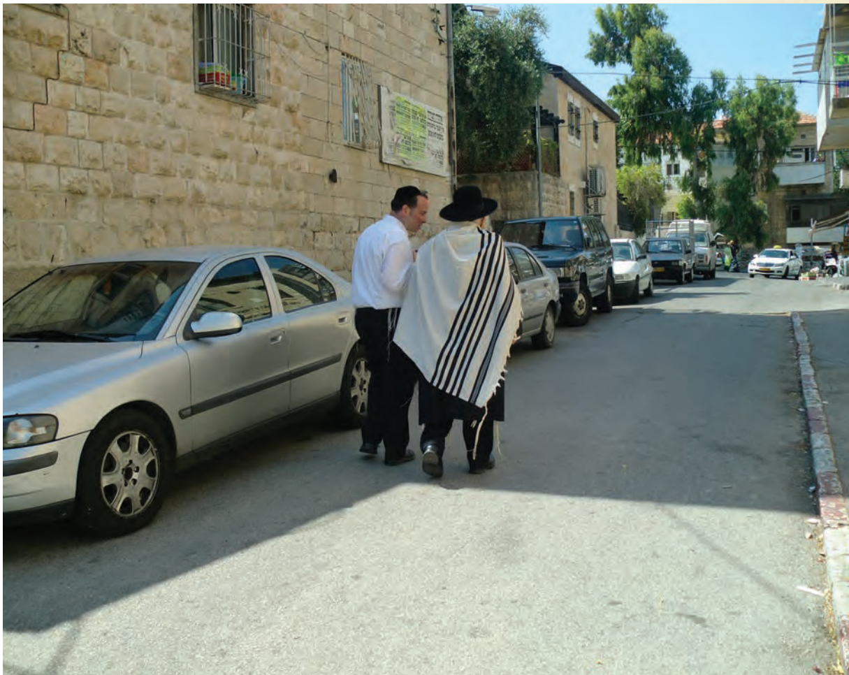
אדם עומד על דברי תורה אלא אם כן נכשל בהם, ואחז"ל בריש ע"ז שלא חטאו ישראל במדבר אלא כדי שילמדו מהם דרך תשובה". ומכאן הדחיפה לחיבור החדש?

ברכישת ידיעות בכל הש"ס, באופן שאין ענין האחד נוגע במשנהו כחוט השערה, וכן זמן תורה לחוד וזמן תפילה לחוד, ותפילה היא מן הדברים העומדים ברום עולם ובני אדם מזלזלים בהם כמ"ש כרום זולות לבני אדם, וכן זמן מוסר מוקדש למוסר עם כל החמימות, וגם כשהיה שר זמירות בשבת, ובשמחת תורה, היה עם כל רוממות הלב, וכן גם בשמחת חתן שהיה מוסר את עצמו למה שעושה שיהיה בשלימות. וכך ראו אצלו תמיד שהבין אדם למקום אינו סותר לבין אדם לחברו, וכלשונו ואהבת את ד' אלוקיך ואהבת לרעך כמוך מרועה אחד ניתנו, וכמובן שיש לכל דבר את המשקל האמיתי לפי רצונו ית"ש".