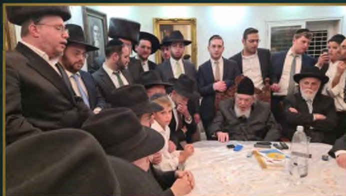
בקבלת פנים בחג