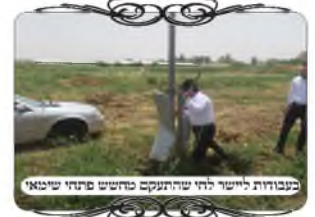
בעבודת ליישר לוח שהתקנס מחשש פתחי שיבוא

[ויש להוסיף ולבאר, שיש מקרים שלא מדובר בקיר נמוך, אלא בקרקע גבוהה, דהיינו שיש על גבה רוחב ד' על ד' טפחים, ואז באמת צריך לחשב את גובה ה' טפחים בעמוד שיהיה י' מעל הקרקע הגבוהה, כמבואר בחז"א (סי' ס"ז ס"ק י"ג), ומ"מ גם באופנים אלו אין חסרון שהעמוד מוסתר במחיצה, אלא רק שיהיה בו