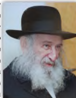
רבי משה סולוביציק זצ"ל

גם בשנים המאוחרות בכל פעם שהיה נכנס מי מבניו של רבי משה, היה רבינו מקבל בחיוך רב ובהארת פנים מאירה.