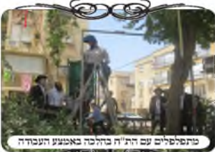
מתפללים עם הת"ח בהלכה באמצע העבודה

בהתקנת צורת הפתח במקום זה, שאינו רחב יותר משלש מטרים, ואינו מעבר לרכבים, האפשרות הטובה יותר היא לעשות כעין שער מברזל, ולא חוט עירוב ואכמ"ל. וכאן שהיה קיר נמוך לאורך הפירצה, התעורר דיון הלכתי היכן המקום המתאים להעמיד את העמודים, והדבר תלוי בכמה הלכות לאחר שהכרענו על המקום המתאים והתחלנו בעבודות, נעצרו ת"ח שעברו במקום, והחלו לשאול ולהתדיין מדוע אין בעיה כזו או אחרת, עד שראו שהכל נעשה בדקדוק של סנטימטר, כדי שיהיה מהודר בתכלית הדבר הראשון הוא, שבאופן נורמלי בעלי המלאכה מעמידים את העמודים על הגדר, אבל בהלכות עירובין יש בזה בעיה שהעמוד מתחיל בגובה יותר מג' טפחים מעל הקרקע, ומבואר בחזו"א (סי' ע' ס"ק י"ח) שנחשב כמחיצה תלויה [למרות שאין חלל מתחת העמוד, כי נכלל בדין מחיצה תלויה, ששיעור המחיצה מתחיל מהקרקע, ואמנם במחיצה היה אפשר לצרף את הקיר התחתון למחיצה, ואז ביחד עם הקיר היא מתחילה מהקרקע ואינה תלויה, אבל בעמוד של צורת הפתח שאי אפשר לצרף את הקיר שיחשב כעמוד [מחמת דין פתחי שימאי, ומחמת שאין בקיר גובה ביחס לכיוון הפתח], לכן צריך להתחיל את העמוד מהקרקע או בתוך ג' טפחים לקרקע שלפני הקרקע, ולא ניתן להתחיל אותו מעל הקיר שגבהו ג' טפחים. [אמנם בחזו"א במקום אחר (סי' ע' סק"ה) משמע שיש להכשיר באופן ששני העמודים עומדים על אותו קיר, שהם כעין משקוף של חלון, ויש מתירים עפ"ז. בכל זאת כאן אפשר לצאת ידי כל הדעות], לכן העמדנו את העמודים לפני הקיר, באופן שהם מתחילים מהקרקע ממש.