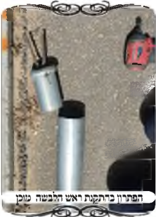
הפתרון ברתקת ראש הלבשה טובין

מהעמוד, קשרו לו אבן קטנה באמצע שתכבד עליו ושלשלו את האבן ואמצע היה לתוך פתח הצינור בראש העמוד, וכך היה להם שני ברזלים בשני הדפנות של העמוד. שמחנו לראות את הפתרון היצירתי, אך הם ביקשו שנחליף את הראש לראש תקין. החיסרון בפתרון שאילתרו הוא, א