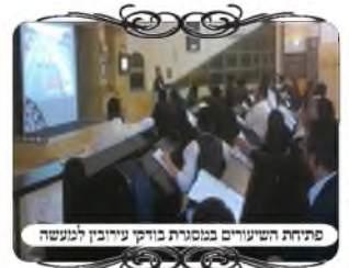
פתיחת השיעורים במסגרת בודק עירובין למעשה

במקביל נפתחו בבני ברק שתי סידרות, האחת עוסקת בדיני העירובים כמו בשאר הערים, והסידרה השנייה בדיני התחומין, כולל צורת המדידה והחישוב של דיני התחום בזמנינו, כיצד מודדים ואיך מרבעים לשיטות השונות, עם לימוד המשנ"ב והשאלות האקטואליות בזמנינו. סידרות אלו מתקיימות כעת במסלול מרוכז, כדי לסיים עד ימי בין הזמנים בחדש אב, שבעז"ה יהיו כבר עוד כמה עשרות יודעי הלכה ברחבי הארץ, ויביאו תועלת וזיכוי הרבים לכל העם.