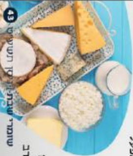
שומרי שבת: יום חשישי 43

יצור המזון ל פ ר ת מ ר ש ב ת בשבת! כדי שגם בפרות יתקיים "מי שטוח בערב