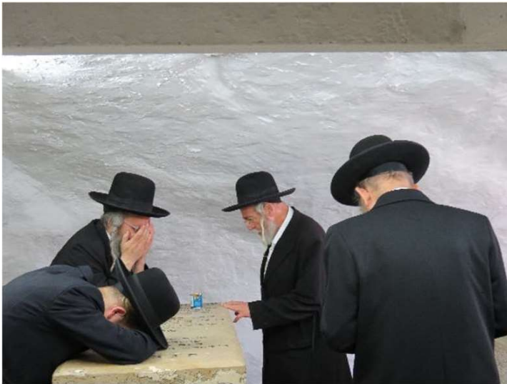
בציון של הרבי הבית ישראל

י. היה קאצק'ר חסיד אמיתי, פעם אמרתי לו ד"ש מנכדו שאני לומד עימו, ואני מלא התפעלות ממנו, תגובתו הייתה "הוא יכול יותר", ולא היה זה במין טרוניה או דחייה, הרגשתי שהוא אומר זאת במלוא הערכה אליו, אך אינו מתבלבל.