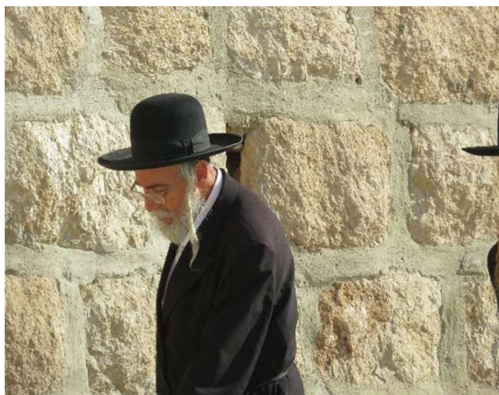
ליד הקבר של חמיו זצ"ל