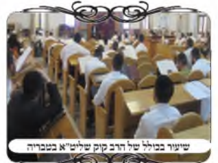
שיעור בכולל של הרב קוק שליט"א בטבריה

כנס נוסף התקיים בבית המדרש שמחת אריה, בהשתתפות פנימי השלשה כוללים מהשכונה, ובהשתתפות