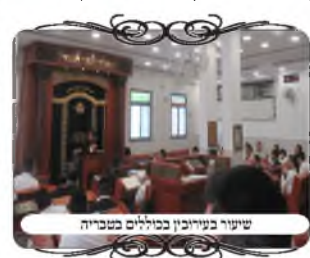
שיעור בעירובין בכוללים בטבריה

יחד עם זאת עמדנו על שתי סיבות חשובות, שחשוב לכל אדם לדעת מהו עירוב, מה משמשים החוטים והעמודים, ואיך הם צריכים להיות, זה לא דבר ששייך רק לאחראי על העיר, אלא כל אדם. א. אם לא יודעים את הנושא של העירוב, מצוי שנכשלים ביציאה מחוץ לגבולות. כגון אדם שיוצא לחוף הכינרת, הרי הוא עובר את החוט של העירוב שנמצא קרוב לכביש, ואסור להוציא שום דבר מחוץ לעירוב וכן בשכונות נוף פוריה, שהגבול של העירוב העירוני עובר