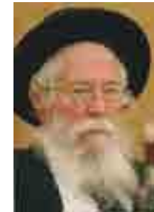
הרב זלמן נחמיה גולדברג