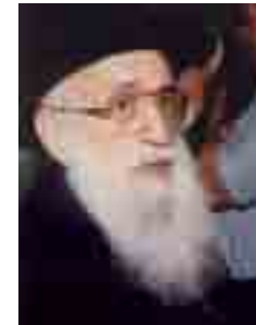
הרב שלמה גורן