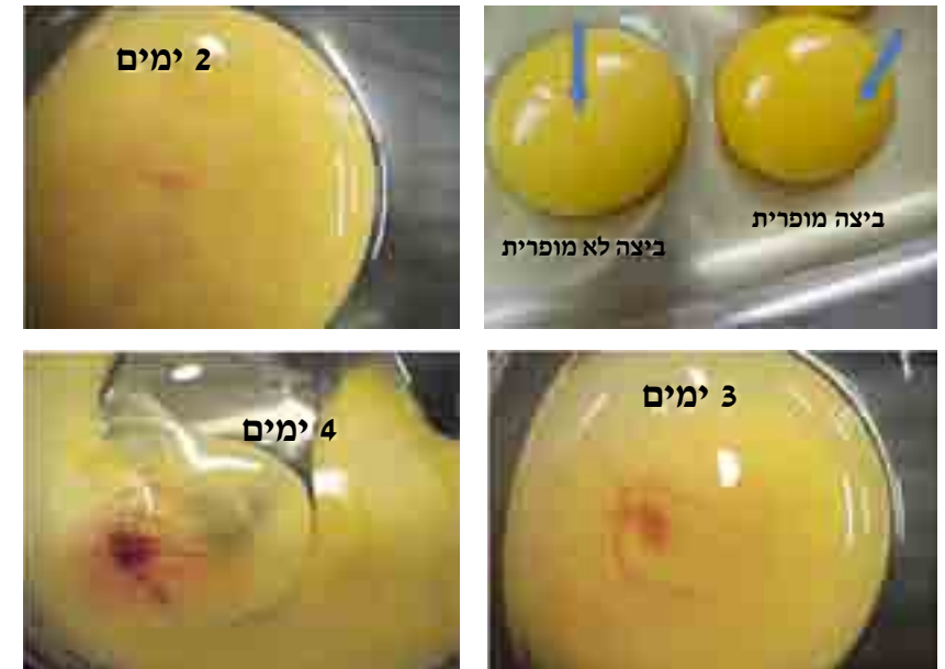
ארבעה שלבים בהתפתחות ביצה מופרית.

מורכב יותר. לפיכך, אם התאים המשמשים את חברות הבשר המתורבת מקורם אכן מביצה מופרית לא מודגרת התאים האלו יהיו אכן כשרים ופרווה, אך אם התאים נלקחו מאפרוח המתפתח בביצה או מתאי דם שנלקחו אחר מספר ימים של דגירה ההיתר מוטל בספק, והאמירה הגורפת שלקחת תאים מביצי תרנגולות מופרות (לפני שעברו 72 שעות מההפרייה) היא נטולת בעיות הלכתיות היא שגויה ומטעה.