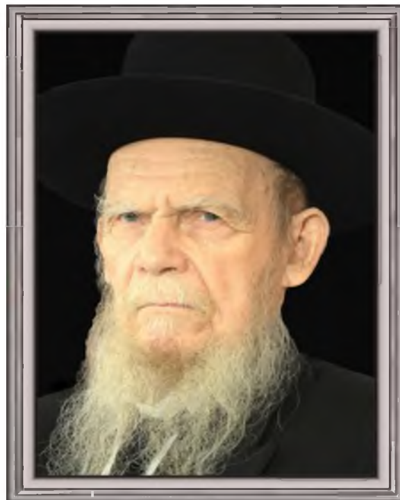
מרן הגאון רבי גרשון אדלשטיין. החזו"א הגדיר אותו כ'מחוסר-אבר'... בגלל היותו חף מגאוה

● ואם דיברנו על דעת תורה וגדולי ישראל, נספר כאן דבר מופלא שסיפר לנו הגאון רבי שמריהו רוט ביום שמחת תורה, ששמע את הסיפור מהגאון רבי אביגדור טנא , בנו של הגאון רבי שלמה טנא זצ"ל. המדובר בדין תורה שההרכב שלו היה 3 דיינים גדולי תורה, והם מרן הגרא"מ שך , מרן הגר"ש רוזובסקי ומרן הגר"ש טנא - זכר צדיקים לברכה. בין הגרא"מ שך לגר"ש טנא התעורר וויכוח באיזה בית ייערך הדיון, האם אצל הגרא"מ או אצל הגר"ש, וכמובן