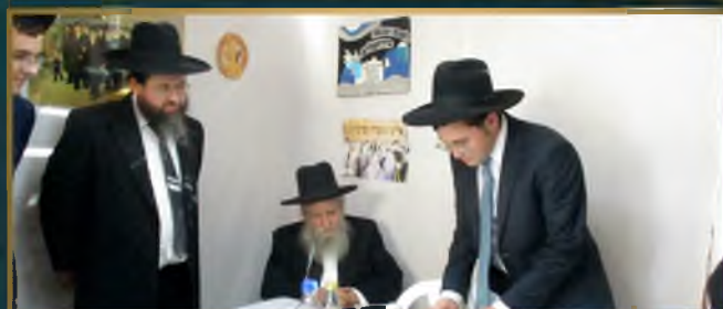
ראשי ישיבת גרודנא מרנן הגר"י הקד והגר"צ דרבקין במוצאי יום הכיפורים