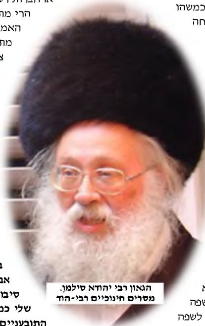
הגאון רבי יהודא סילמן. מסרים חינוכיים רבי-הד

לעתים קרובות, ההורים מתייאשים מוקדם מדי, וזה פשוט אסון. יתכן שהמרשם להצלחה לא ברור להם, ואז הם חייבים ללכת ליועץ, ואין בזה עצה כללית. אבל היסוד הראשון צריך להיות בהבנה שהדרך להצלחה נעוצה בעיקר ביצירת קשר טוב