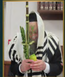
זקן דה"י דאדופה הגר"י זוויל דה"י חכמי צדפת ואב"ד עקס לע בען בצדפת