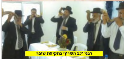
רבני 'לב השרון' בתקיעת שופר

הישובים, אלא גם בשמירת שמיטה ללא פשרות. מי היה מאמין.