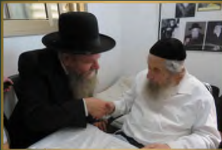
הגאון רבי מרדכי שמואל ארלשטיין