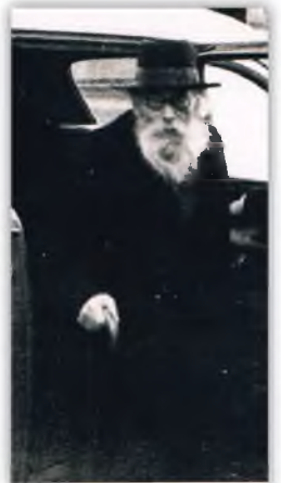
מרן החזון איש: הבחורים אינם מחויבים

אך, למרבה ההפתעה, כאשר שמע החזון איש את הצעתו הוא אמנם בירך אותו על המהלך אך הביע הסתייגות באומרו "דע לך, כי הבחורים מצידם אינם מחויבים לקיים את ההתחייבות, אפילו אם הם חתמו. הלא זה מתנה על מה שכתוב בתורה", סיים החזון איש את הנימוק. עובדא זו גם מובאת בספר מעשה איש ח"ב עמוד ר"צ.