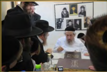
חתן מדרן הגר"ח זצוק"ל הגר"י צביזון