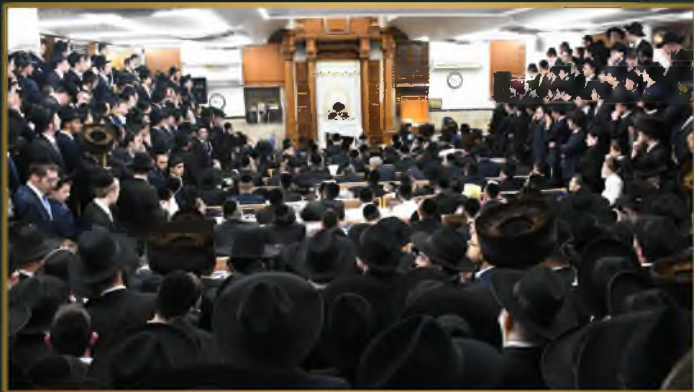
בשמחת בית השואבה בבית מדרשו