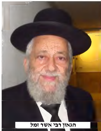
הגאון רבי אשר זמל

● לאחר שרכשנו את שני המינים הללו, התעוררה בעיה חמורה כיצד ניתן יהיה להביא אותם אל תוככי רוסיה, בה אסור היה לשמור תורה ומצוות. השנים הללו כבר נשכחו קצת מאתנו, בגלל השינוי שחל בברית המועצות דאז, אבל המציאות היתה שמי שנתפס בשמירת מצוות, ובעניינו - העברת האתרוג והלולב לתוככי המדינה הסובייטית - היה נענש בעונשים כבדים מאוד.