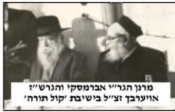
מרנן הגר"י אברמסקי והגרש"י אויערבאך זצ"ל בישיבת 'קול תורה'

ונראה שזה הסימן, שאם היה זה אביו, אחיו או בנו, גם היה צחוק, זה סימן שמדובר בצחוק; אך אם במקרה שהיה זה אחד מקרוביו לא היה צחוק, אם כן הצחוק אינו נובע ממידות טובות, אלא יש בזה קצת צחוק מכשולן חברו. אלא שיתכן