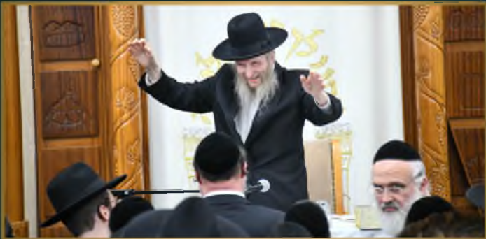
שמחת חג בסוכת מדרן הגרמ"ש אדלשטיין שליט"א