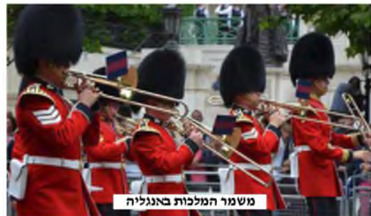
משמר המלכות באנגליה

מרת הגר"ש אלישיב זצ"ל אמר, שנוסח הברכה מתייחס על גינוני-הכבוד הניתנים למלך, וזאת ראינו באנגליה בצורה מאוד בולטת, וכפי שמפורסם בכל העולם, שכבוד המלכות שם הוא מיוחד. במצב זה, אמר מרת זצ"ל, לא צריך את התנאי שתהיה לו אפשרות להרוג אנשים.