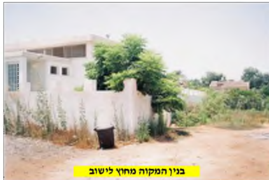
בנין המקווה מחוץ לישוב

● המתנגדים של אז, שכאמור לקו בחוסר-מודעות ובחוסר-עניין לנושאי הדת, היו מתפללים עתה על המכתבים שהגיעו למשרדי המועצה האזורית לב השרון והמיועדים לוועדה לענייני דת. טפסים אלה מביעים בעצם מהותם את הפסוק 'כל כלי יוצר עליך לא יצלח', ואם אמנם המקווה נבנה אז מחוץ לגדר, אבל בניהם ובני-בניהם של אותם מתנגדים מעוניינים כיום לא רק במקווה טהרה כדת וכדין בתוככי