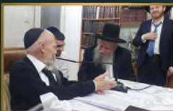
מדרן הגר"א פולין שליט"א