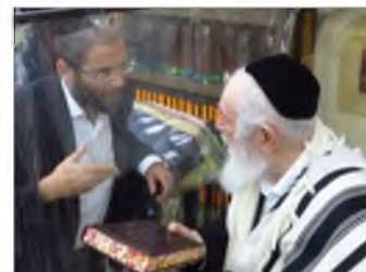
הרב מקבל את הספר 'לבבו נאמן'