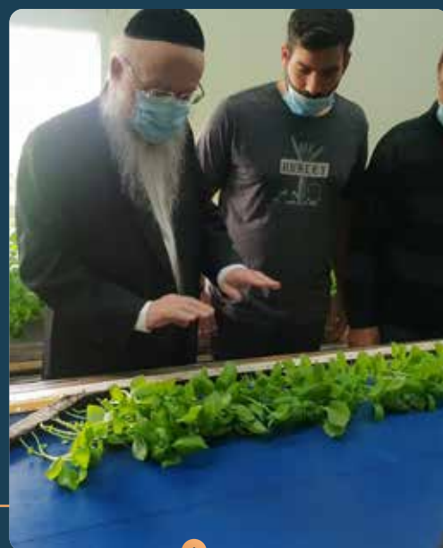
הגר"י אפרתי שליט"א בסיור בגידולי נוכרים בשמיטה