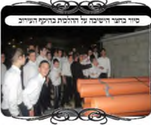
סיוע בחצר הישיבה על הדלסת בחניק העירוב

שלושה דברים מיוחדים בביכנ"ס וישיבות במודיעין עילית אך יש עוד דבר מיוחד בעיר זו, שהרבה בתי כנסת וישיבות נמצאות על גבולות העיר, והאחרים על העירוב אומרים שאינם יכולים להכניס אותם בעירוב, כי הם עושים שינויים כל קצת זמן, מוסיפים קראונים, מזיזים, מורידים גדרות ומרחיבים, ואי אפשר כל שבוע לטפל לכל אחד בחצר שלו, לכן העירוב של העיר מסתיים בגבול המדרכה, ומי שיש לו בית כנסת או ישיבה, שיעשה עירוב לבד.