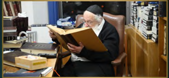
מורן הגאון רבי חיים פיינשטיין שליט"א בשיחת חזקת בבית המדרש 'בית השם' ב"ב