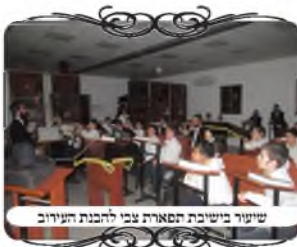
שיעור בישיבת תפארת צבי להבנת העירוב

כמובן שלצערנו יש אנשים שאינם מודעים לנושא, ואינם שמים לב. לפעמים באים אנשים שנכשלו להתלונן למה לא תולים שלט, ואז אומרים להם שימו לב יש שלט ברור מאוד, אלא שהם לא מסתכלים. כמו כן יש מקומות שאפילו העמידו מחסום עם תמרור, והאנשים החכמים באים עם העגלה מזיזים את המחסום ועוברים, ולא שמים לב שכתוב שזה גבול העירוב. הסיבה היא חוסר המודעות, ומי שאינו שם אל ליבו להישמר כשיצא מביתו, יכול להיכשל אפילו בעיר עם עירוב מהודר ביותר.